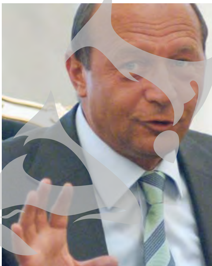
va fi adoptată în CSAT, dar nu înainte de a primi și puncte de vedere ale principalilor aliați ai României.

Președintele a precizat că în momentul de față este elaborată o Carte Albă a diplomației românești, precum și strategia României pentru zona extinsă a Mării Negre. Această strategie