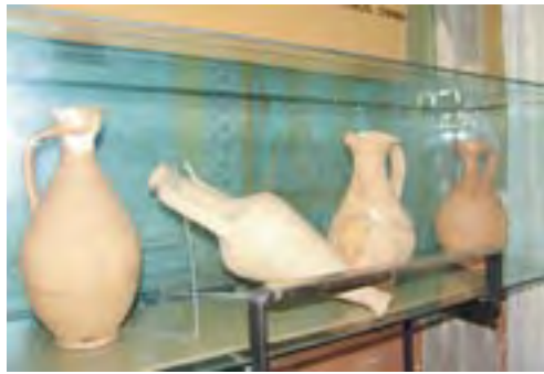
Câteva dintre exponatele Muzeului de Istorie din Tecuci