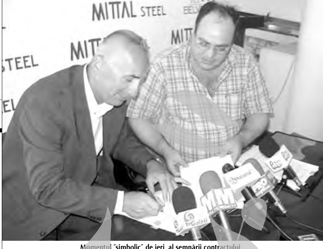
Momentul "simbolic" de ieri, al semnării contractului...