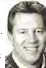
John C. Maxwell

"Un om trebuie să fie suficient de matur pentru a-și recunoaște greșelile, suficient de deștept ca să profite de pe urma lor și suficient de puternic pentru a le corecta."