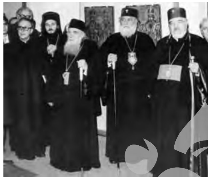
Mai 1992, întru Hristos, la Palatul Episcopal al Dunării de Jos

În dorința de a păstra vie amintirea Înalț Prea Sfințitului Mitropolit Antonie Plămădeală, oferim cititorilor noștri câteva fragmente semnificative din opera sa, mărturii-testament ale vocației slujitoare ale unui mare ierarh al Bisericii Ortodoxe Române.