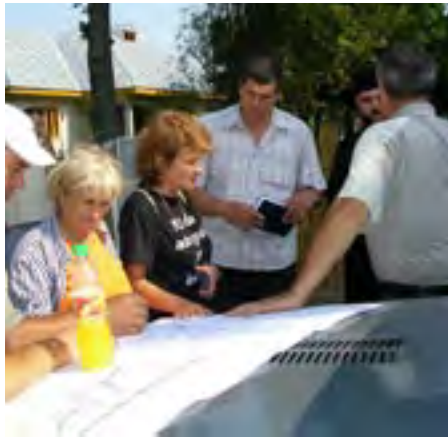
La Torcești - echipa Episcopiei Dunării de Jos făcând planuri de casă nouă pentru sinistrați