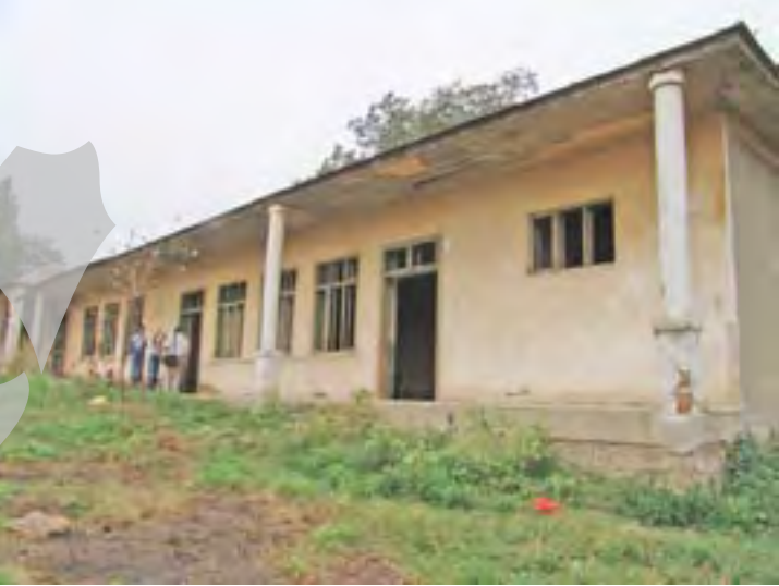
Fostul „centru civic” al Hânțeștiului

Unele familii, care cresc animale în gospodărie, nu se pot lăsa doar pe baza fântâniei. Nici dacă ar învăț și zi și noapte la manivelă și tot n-ar putea scoate apă cât să sature 4-5 vaci și 30-40 de oi. Ca atare, oamenii sunt nevoiți să... importe apă din satul vecin.