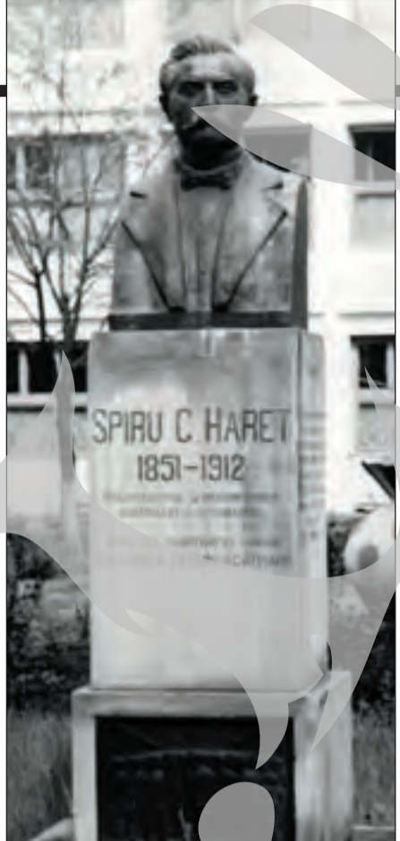
text: "Ridicatu-s-a acest monument din inițiativa unui comitet prin subscripție publică în semn de adăncă recunoștință și dreptă judecată pentru munca de zi și noapte a lui Spiru C. Haret pusă întru ridicarea și propagarea culturală și economică a neamului nostru. Tecuci, 1935 noiembrie 17".

vitetea dezvelirii lui în fața clădirii Liceului "Elena și Tache Anastasiu". Manifestarea s-a desfășurat în prezența dr. Constantin Angelescu, ministrul Instrucției, Cultelor și Artelor, și a profesorului universitar Ion Simionescu.