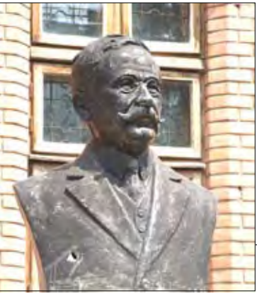
Bustul lui Nicolae Longinescu (Galați)

Katia Nanu: "Nimic din ce am scris vreodată, nimic din ce am publicat nu mi-a adus bucurie mai mare decât cărțile pentru copii"