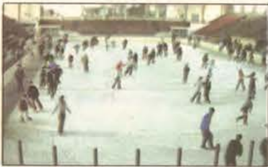
Distracție de sezon