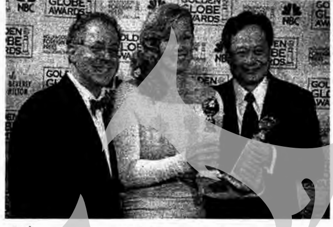
Străine de la Hollywood. Spre deosebire de Oscaruri, Globurile de Aur au categorii separate pentru drame, musicaluri și comedii. Globurile de Aur sunt considerate un indicator bun pentru premiile Oscar ce vor fi acordate pe 5 martie.