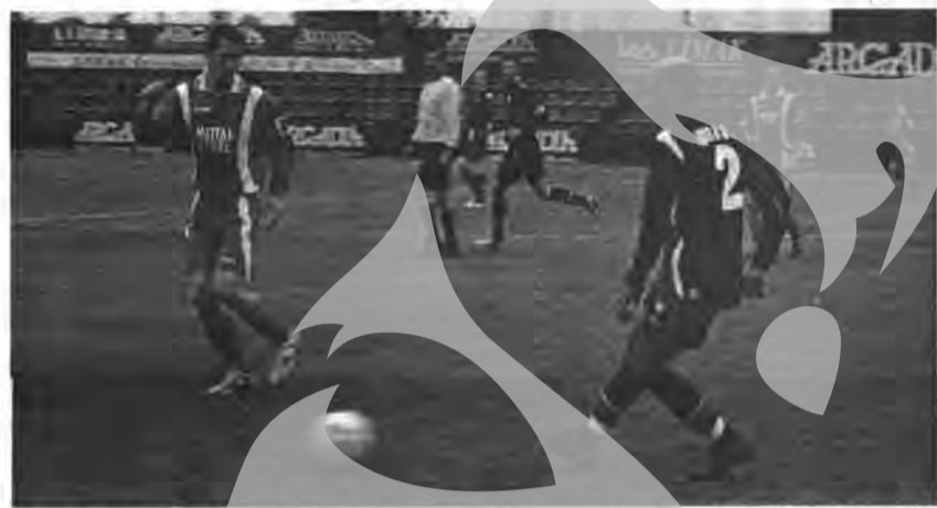
Juniorul Elek (stânga), în duel cu camerunezul Branco de la Kryilia, putea înscrie pe final, dar a fost faultat în preajma suprafeței de pedeapsă