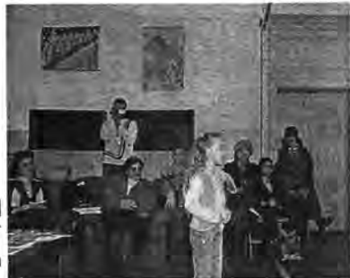
Copii recitând la Salonul literar "Anton Holban"