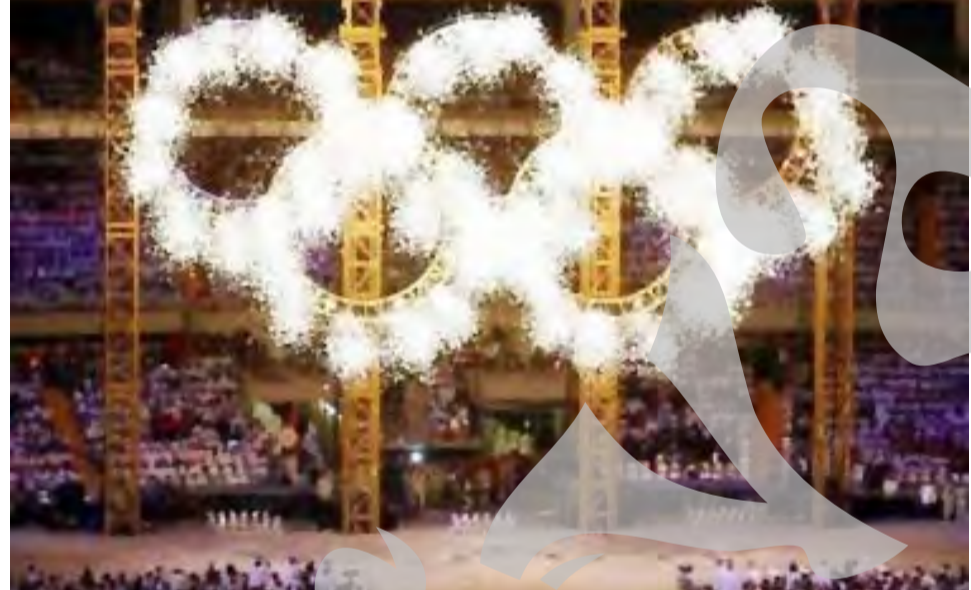
Ceremonia de deschidere a Olimpiadei de la Torino - un spectacol sub semnul „ritmului, pasiunii și vitezei”

Un spectacol ce a adus un omagiu culturii și modei italiene, marcat de apariția remarcabilă a tenorului Luciano Pavarotti, a caracterizat ceremonia de deschidere a celei de-a XX-a ediții a Jocurilor Olimpice de iarnă, care s-a desfășurat, vineri noapte, pe Stadionul Olimpic din Torino. Pe parcursul unei ceremonii ce a durat două ore și jumătate și care a fost plasată sub semnul „ritmului, pasiunii și vitezei”, fostul Studio Comunale, în întregime renovat și rebotezat cu această ocazie, s-a transformat într-o scenă gigantică de 6.000 metri pătrați, înconjurată de public și ocupată de 470 de dansatori. De la designerul Giorgio Armani, care s-a ocupat de punerea în scenă a intrării drapelului Italiei în incinta stadionului, și până la actrița Sophia Loren, toate vedetele Peninsulei au fost asociate cu deschiderea Olimpiadei. Dar, unul dintre momentele emoționante ale cere-