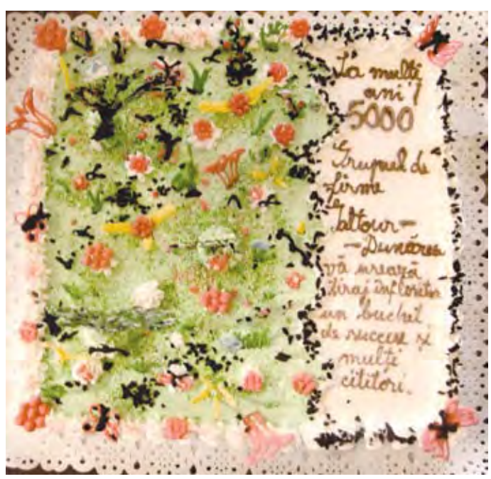
S.A.T.