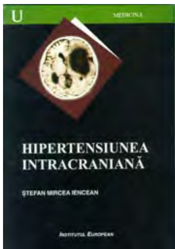
* Iași, Editura Institutului European, 2006. 205 p. (Colecția "Universitară". Seria "Medicină")

intracraniană parenchimatosa = Hipertensiunea intracraniană de etiologie vasculară = Hipertensiunea intracraniană prin tulburarea dinamicii LCR-ului = Hipertensiunea intracraniană idiopatică = Evoluție și prognostic = Tratatamentul hipertensiunii intracraniene = Hipotensiunea intracraniană. Prezentând un subiect deosebit de important pentru neurologie și neurochirurgie, dar și pentru alte specialități medico-chirurgicale, lucrarea se adresează tuturor medicilor și studenților în medicină, dar mai ales specialiștilor în neurologie, neurochirurgie și în terapia de urgență.