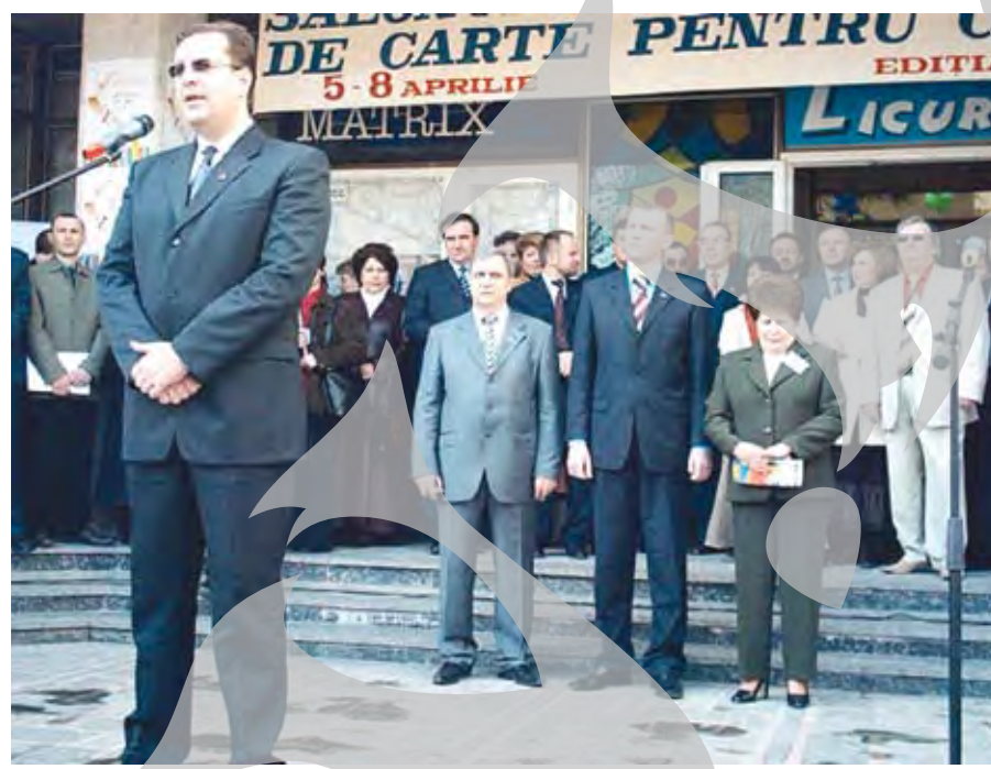
Președintele Parlamentului Republicii Moldova, la deschiderea Salonului

Galațiul a beneficiat de un stand destul de central, la etaj. Echipa de la Biblioteca „V.A. Urechia” s-a îngrijit de punerea în valoare a cărților gălățenilor și de lansările de carte, bine primite de