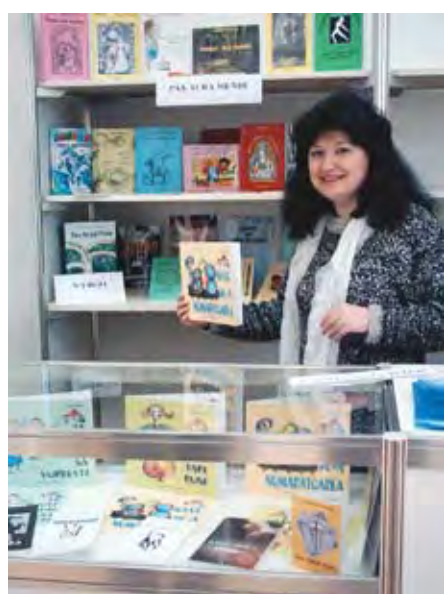
La standul gălățean