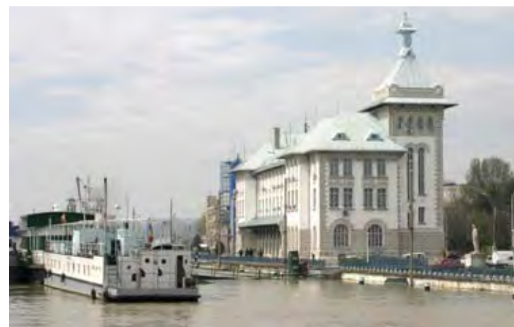
Pagină realizată de Laura Gurău