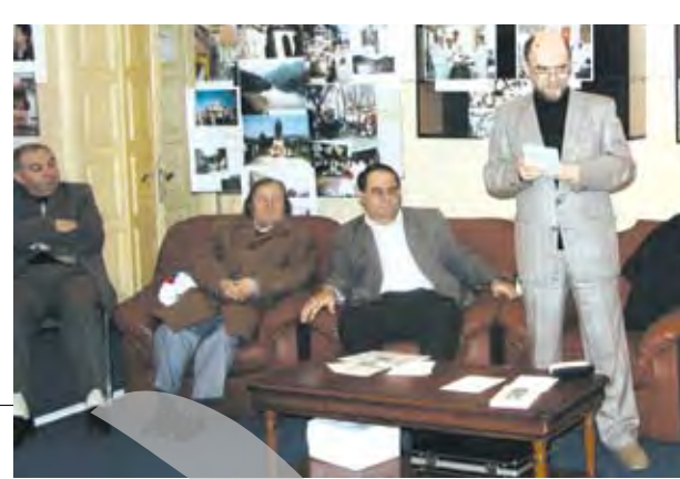
Întâlnire de excepție la Cenaclul Salonului literar "Anton Holban"

O lansare regală, la Salonul Literar "Anton Holban"