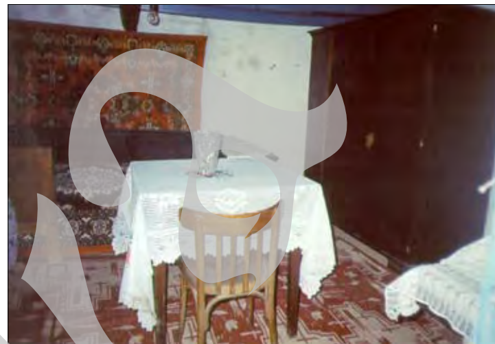
Camera de oaspeți, sub mîna harnicelor gospodine...