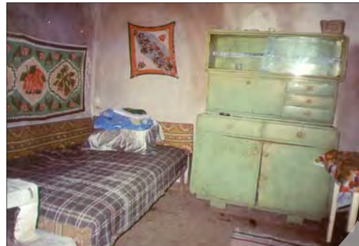
Așa arată o bucătărie dereticată...