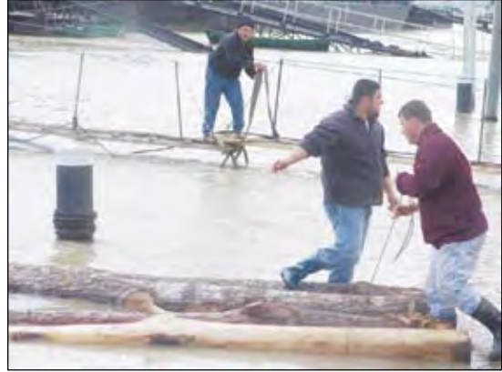
Lemn marca... inundații