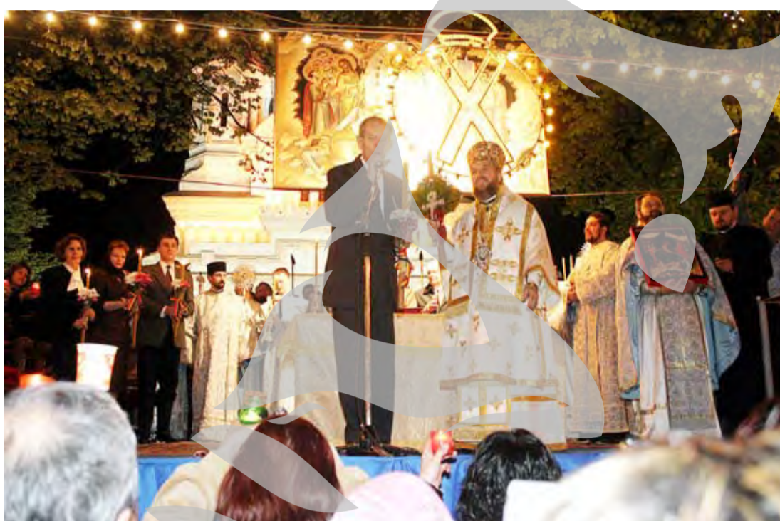
viați întru Domnul”.