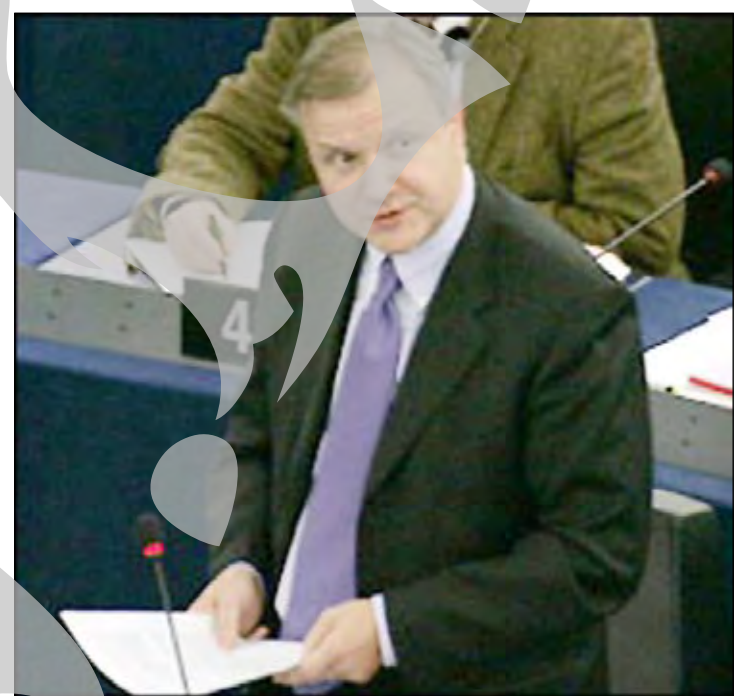
CE va continua să ofere sprijin financiar substanțial pentru pregătirea țării noastre în vederea aderării, cu accent pe domeniile în care trebuie acoperite decala-

la 14 la 4. El a avertizat că, dacă România și Bulgaria nu vor lua măsuri în domeniile de îngrijorare, atunci nu vor fi gata pentru aderare în acestea. Olli Rehn a menționat că Tratatul de aderare a celor două țări cuprinde mecanisme de monitorizare și clauze de salvagardare și a îndemnat statele membre care încă nu l-au ratificat să o facă în perioada următoare. Chiar dacă s-a exprimat o dată fixă a integrării - 1 ianuarie 2007, Comisia Europeană a subliniat faptul că va continua să monitorizeze progresele înregistrate de România până în momentul aderării. De asemenea,