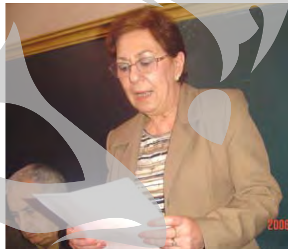
A consemnat Nicoleta Crănganu

- Mai multe: articolul nu mai este parte de vorbire, ci, în unele cazuri, desinență (acolo unde face corp comun cu substantivul), alteleori, e pronume semiindependent. Numeralul, care, așa cum era gândit, era foarte eterogen, a dispărut și el ca clasă gramaticală. La verb, reflexivul avea foarte multe valori, or, în noua Gramatică, am renunțat la o serie de distincții care, după părerea noastră, nu erau necesare. A rămas o singură diateză, cea pasivă. În sintaxă, subiectul devine