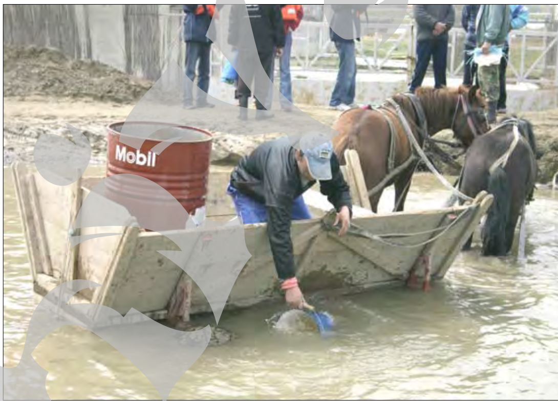
La Grindu și Garvăn, localnicii beau apă din Dunăre