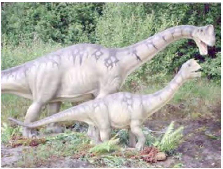
această specie măsurau până la 1,7 metri. Potrivit cercetătorilor, Europasaurus holgeri constituie primul caz de nanism în lumea dinozaurilor.