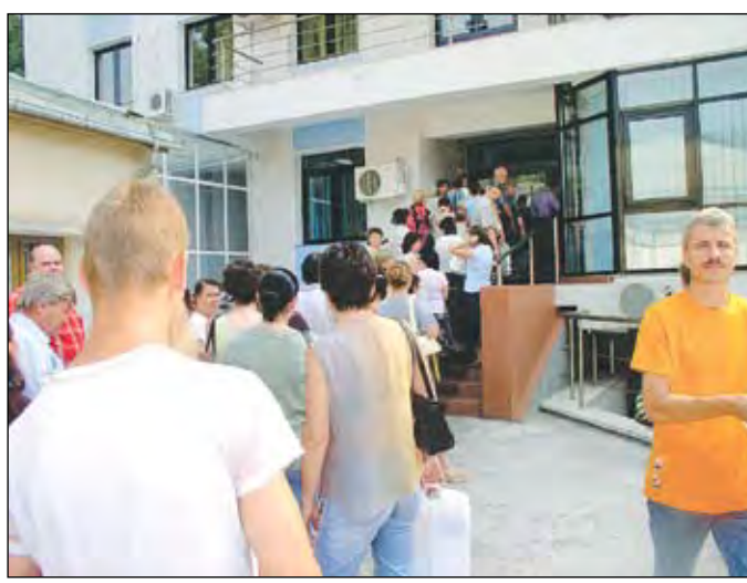
CONTINUAȚIE ÎN PAGINA 3

angajatorii, persoanele fizice autorizate și liber profesioniștii, au obligația să depună concediile medicale curente, spre a fi decontate, precum și un centralizator cu evidența salariilor care au beneficiat de concedii medicale în luna precedentă. De asemenea, angajatorii trebuie să mai de-