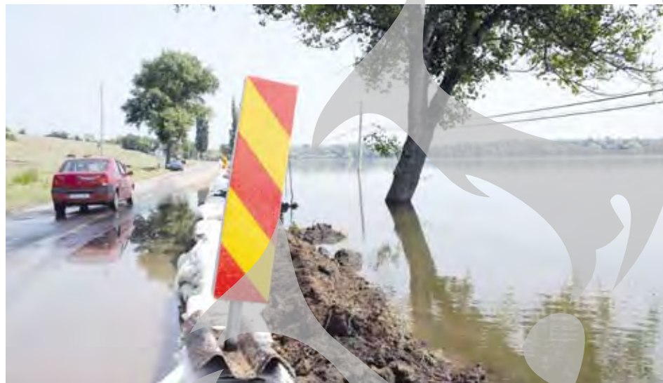
"Peretele" de apă de lângă DN 26

riile despărțitoare ale bazinelor. Doi călugări care altădată asigurau scurgerea controlată a apei între Elan și Balta Rădeanu se transformaseră într-un soi de robinet prin care râul, cu doi metri mai înalt, trecea în balta plină de pește. Încercările de a întări digul cu saci au fost sortite eșecului, asta pentru că debitul Prutului era deja prea mare pentru a mai putea prelua și apele Elanului, iar acesta din urmă începuse astfel să se reverse pe unde putea. De fapt, nici nu se mai știa de unde venea, pe unde trecea și încotro se ducea atâta amar de apă, pentru că, cel puțin în zona de care vorbim, nu se mai distingeau nici bălțile, nici Elanul, nici Prutul... Rămăseseră strajă și ghid numai