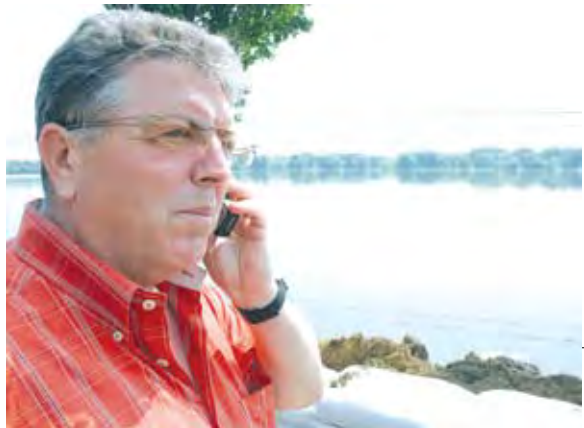
Vasile Curduman, subprefectul județului Galați