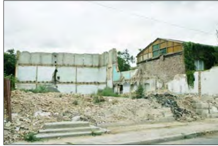
Cuza nr. 43 - Un morman de moloz e tot ce-a mai rămas