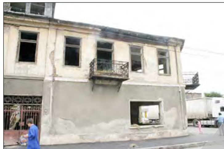
Dogăriei nr. 88- Casa cu stafi

Peste această scurtă descriere au trecut o sută de ani. Ca și peste orașul de la Dunăre. S-au ridicat alte case, s-au modificat drumuri, a dispărut farmecul pescăresc, comercial al portului, înlocuit fiind cu cel muncitoresc al platformei siderurgice. Undeva înainte de mijlocul secolului XX bombardamentul a șters de pe fața orașului aproape întreg Centru, pe care îl mai regăsim acum doar în ilustratele colecțiilor. Au rămas doar vagi urme ale unor clădiri care amintesc de acele trecute timpuri... Este Galațiul mai frumos ca acum 100 de ani, este mai urât după toate câte le-a pățit și pe Vale și pe Deal?