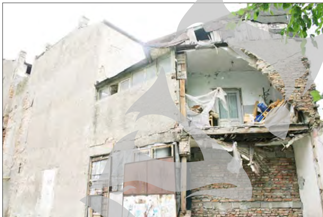
Bălcescu nr.17- Mai lipsesc doar bufnițele