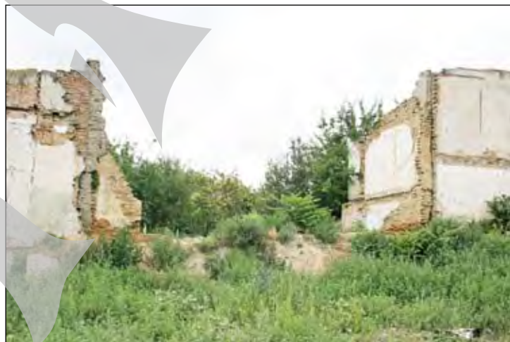
Vadul Cărbuș nr.3- Natura își reintră în drepturi