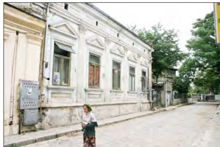
Lahovari nr.7- Dacă zidurile ar putea să vorbească...