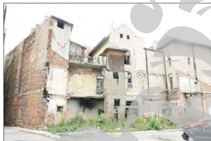
Domnească nr 24- În spatele unui proiect care se năruie încet, dar sigur.