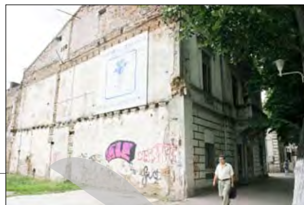
Domnească nr. 54- taman între Primărie și Prefectură...