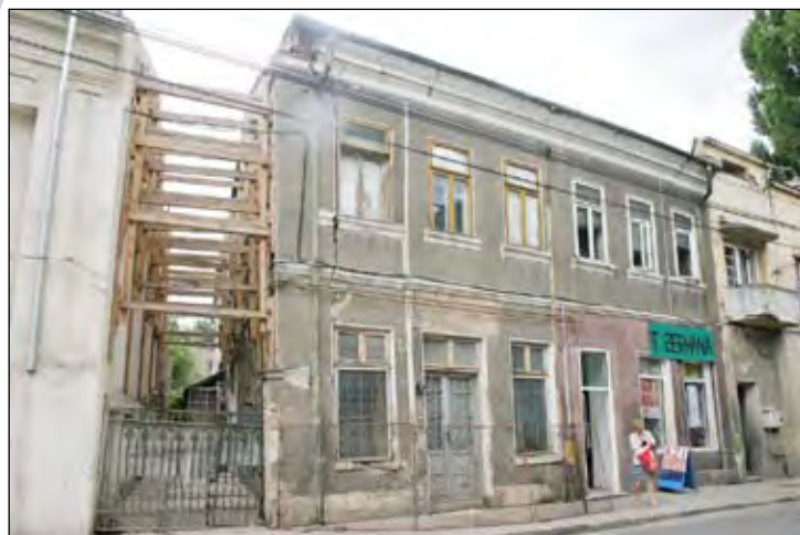
Bălcescu nr.40- Germania e atât de departe!