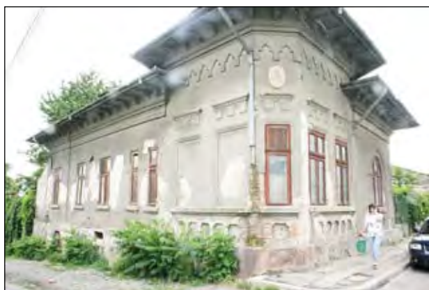
Cuza nr.62 -Jupuite, și casa, și trotuarul...