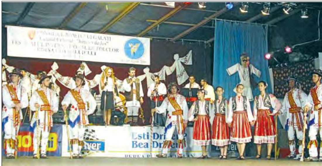
Călușarii și... dansatorii de la "Doina Covurluiului"

Vineri seara, juriul Festivalului Internațional de Folclor „Doina Covurluiului”, ediția I, 2006 - organizat de Centrul Cultural „Dunărea de Jos” și Consiliul Județului Galați - a de-