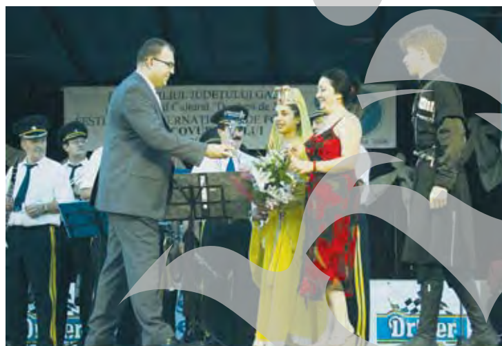
Georgienii pe podium, felicitați de directorul Centrului Cultural

gătoarea, s-a trecut la aprecierea echipelor artistice românești. S-au înmănat diplome de participare mai multor ansambluri din județul nostru și o diplomă de excelență Fanfarei „Valurile