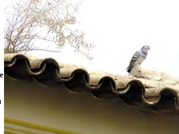
Popas într-o lungă călătorie