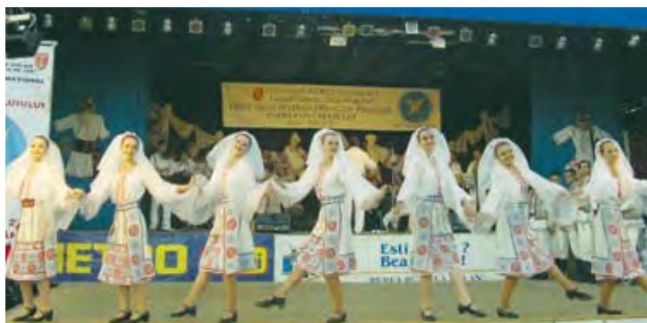
Fetele de pe Nistru, în pași de horă