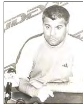
Ceahlăul Piatra Neamț, pe care a promovat-o în primul eșalon!