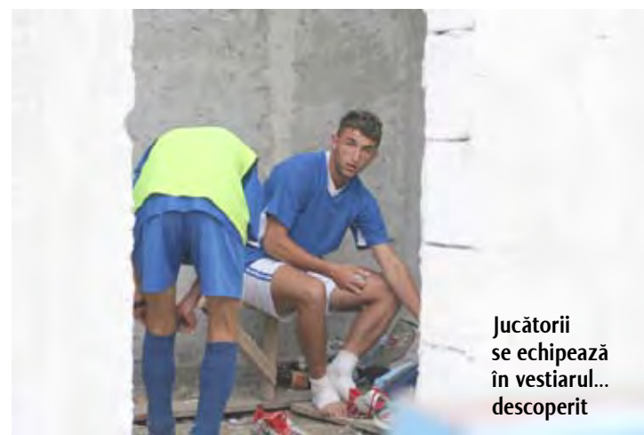
Jucătorii se echipează în vestiarul... descoperit

Pe orice arenă de sport din România găsești și femei, chiar dacă unii se folosesc de circumstanțe de genul „nu-mi aduc femeile din familie la stadion pentru că se înjură.” Aiurea, și acasă se varsă invective, câteodată în cantități industriale. La Branîştea (bănuim că și în celelalte zone rurale ale județului) n-am văzut nici țipenie de femeie la fotbal! Târziu am descoperit că asistența medicală era asigurată exclusiv de doamne. Și am mai sesizat ceva. Dacă pe un stadion așa-zis civilizat nicio injurie nu este însoțită de remușcări, unul dintre fanii echipei Imperfect, căruia i-au ieșit destule minunății anatomice pe gură, își cerea scuze după fiecare recidivă. La un moment dat părea că o face voit, dar măcar întreținea atmosfera. Primarul și polițistul, care probabil știau ce-i poate capul, și-au agățat un zămbet condescendent pe chip și s-au concentrat mai mult pe meci, spărgând seminețe cu conștiințiozitate. Albe, mari, de bostan.