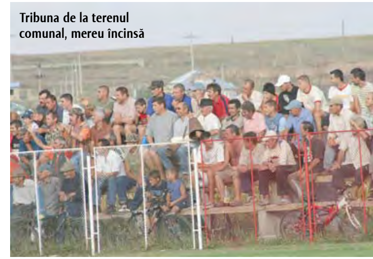
Tribuna de la terenul comunal, mereu încinsă