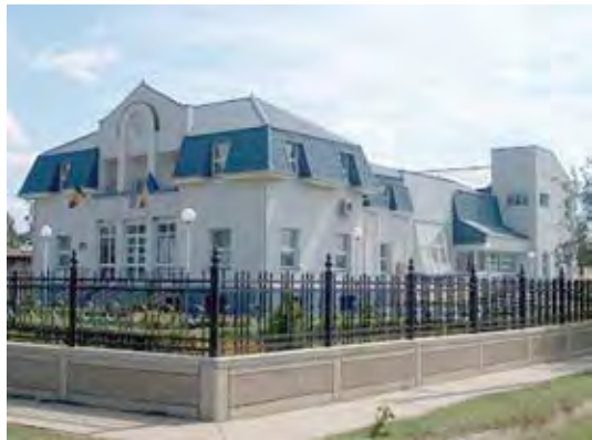
Judecătoria Liești

După prima etapă a concursului de admitere la Institutul Național al Magistraturii (INM) au rămas în cursă 70 de candidați din Galați, din cei 2827 de candidați care aspiră la unul dintre cele 150 de locuri scoase la concurs. Urmează, în perioada următoare, celelalte două etape ale admiterii: proba scrisă și interviul. 62 din concurenții gălățeni vor să devină judecători, iar opt aspiră la un post de procuror.