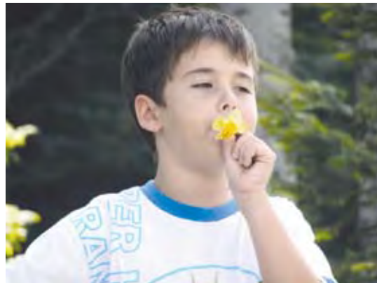
Și băieților le plac florile