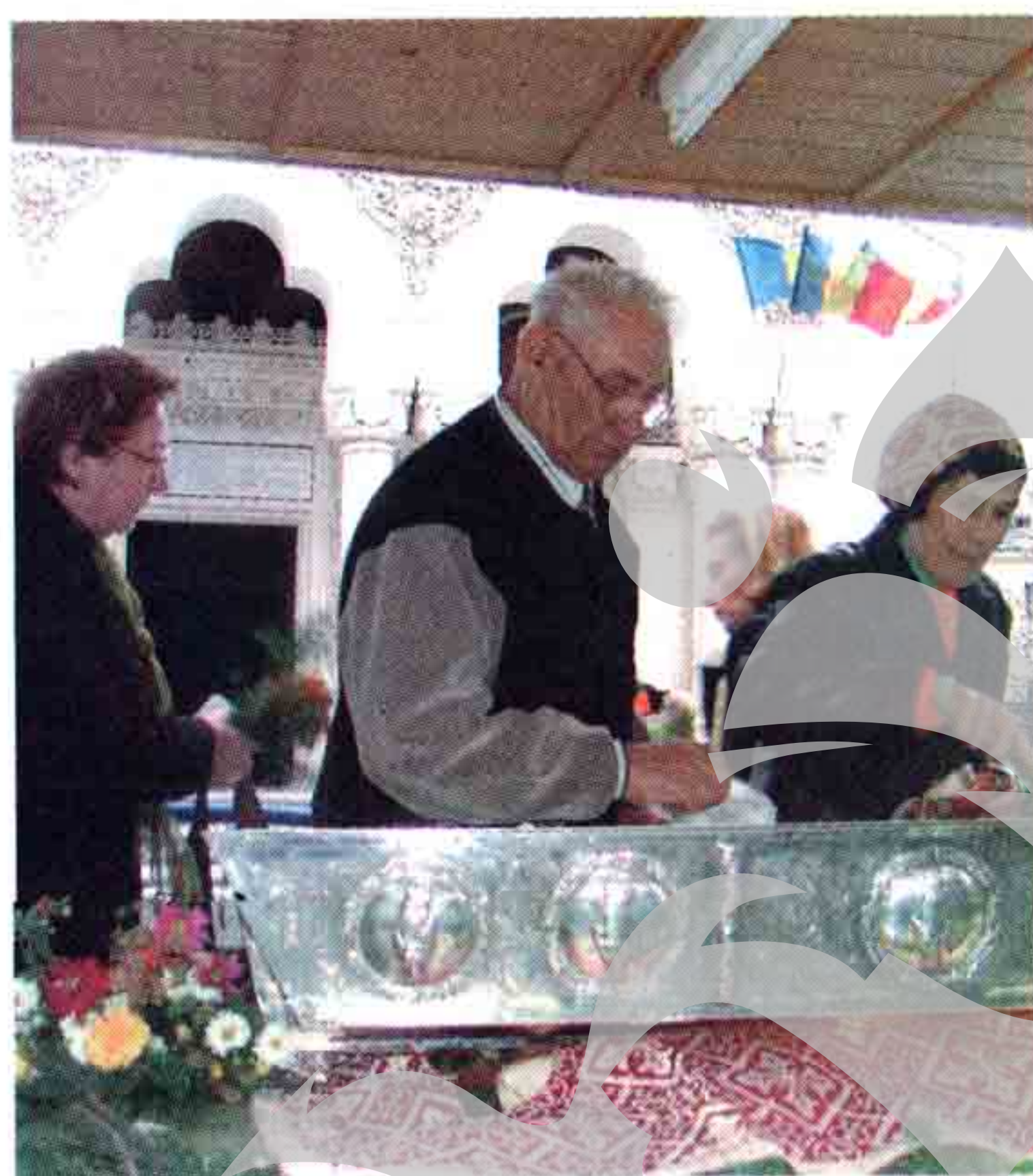
Creștini rugându-se la racla Sfintelor Moaște

În Catedrala Episcopală, alături de Moaștele Sfântului Apostol Andrei, veghează la innoirea noastră spirituală (părțile din) Moaștele Sf. Arhidiacon Ștefan, Sf. Ierarh Nicolae, Sf. Eustahie, Sf. Epifanie, Sf. Haralambie, Sf. Mare Mucenic Gheorghe, Sf. Ioan Gură de Aur, Sf. Ignatie, Sf. Ioan Damaschin, Sf. Pantelimon și Sfânta Maria Magdalena.