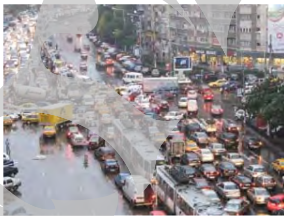
București, capitala țării mele... (internet)