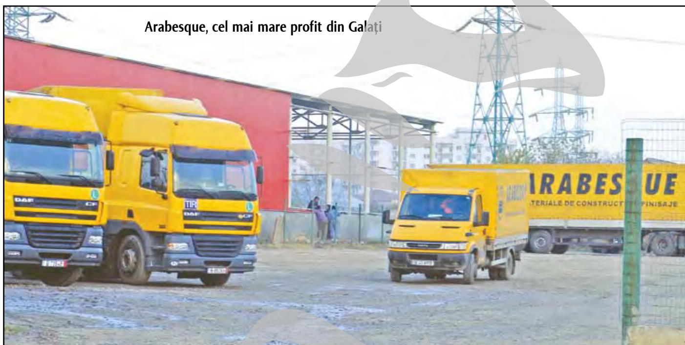
Arabesque, cel mai mare profit din Galați