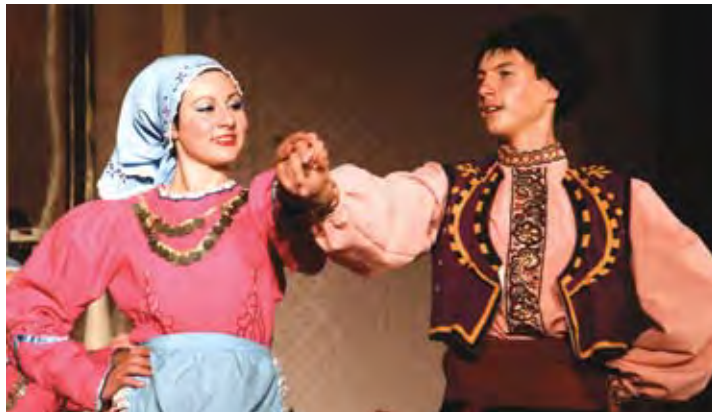
Secvență de folclor turcesc