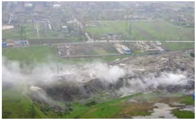
Movileni e sufocat de combinat și de groapa de gunoi