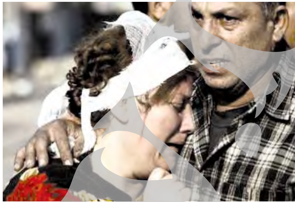
Autorii bombelor artizanale mai diverse disimulări pentru capete umane, câini sau cadavre amplasate în Irak recurg la cele explozibile - biciclete, cadavre, de animale.

Trei copii au murit și un al patrulea a fost rănit, ieri, în urma exploziei unei jucării-capcană pe care o găsiseră în apropierea locuinței lor dintr-un cartier al localității Hawijah, situată în nordul Irakului, au anunțat surse din poliția locală. Explozia a avut loc în jurul orei locale 14.30 (13.30, ora României), în momentul în care unul dintre cei patru băieți a atins jucăria. Doi dintre copiii uciși făceau parte din aceeași familie.