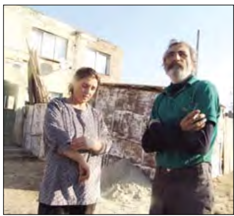
Oameni la marginea civilizației