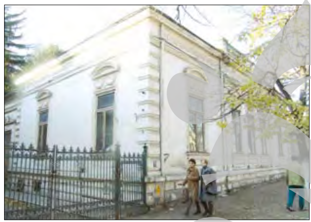
Structura de la sala de box (stânga) și fostul sediu al Muzeului de Științe Naturale