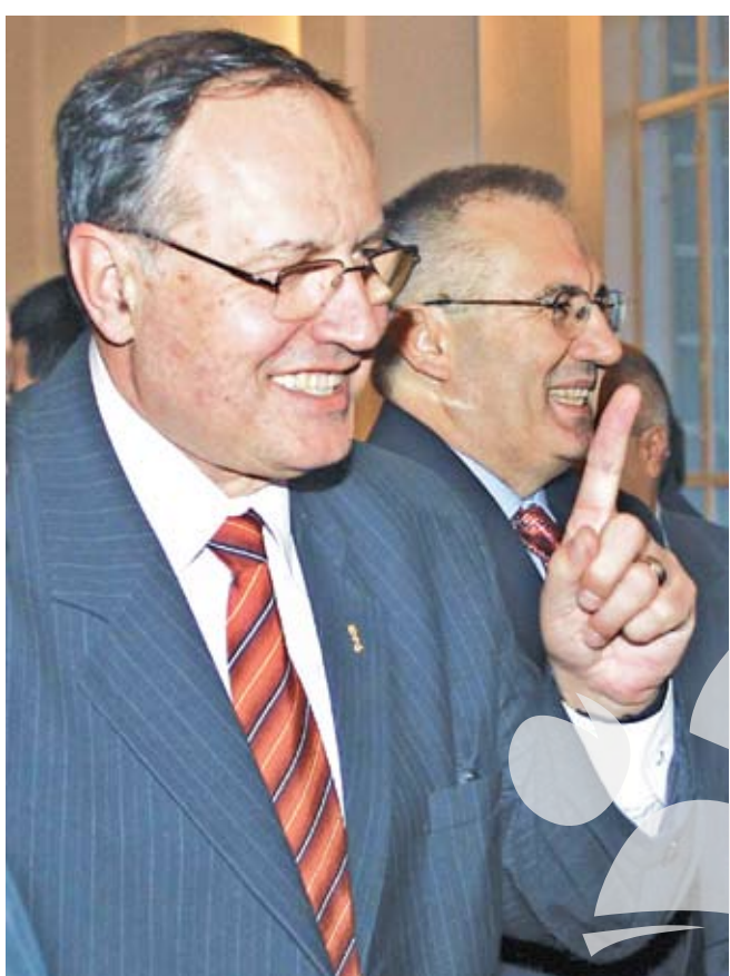
Bun venit în PD-L, dragi liberal democrați!

Ei da, Partidul Democrat s-a... liberalizat și îl cheamă PD-L. Povestea a început cu trecerea PD în Opoziție. De ce? Fricțiuni vechi, orgolii mari, demisii ne-