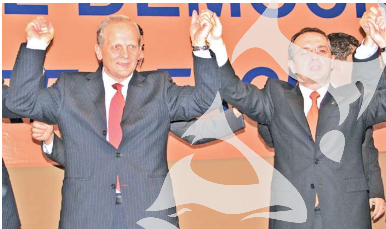
Hora comasării democrat-liberale