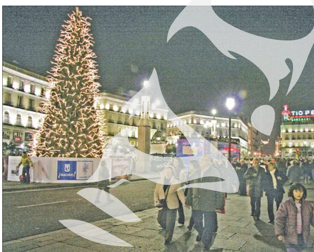
Revelionul i-a scos pe madrilenii în stradă

În Abrantes, miroase a Românie. Este un cartier al Madridului, de clasă medie,