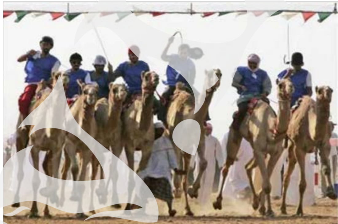
La start Cursa de cămile de la Sweihan (Emiratele Arabe Unite) - 28 decembrie 2007

În curând, aerul deja viciat din Galați va deveni irespirabil, ne atenționează un cititor. El ne și indică o adresă de blog - http://www.cersenin.blogspot.com - unde ne putem spune părerea despre poluarea din orașul de la Dunăre. Motivul creării acestui blog este apariția proiectului unei termocentrale la Galați. Firma Global International 2000 din București a concenționat 36,5 ha de teren în Zona Liberă Galați, unde va construi în parteneriat cu ENEL cea mai mare termocentrală pe cărbune din sud-estul Europei. Despre subiectul acesta am scris și noi. Să vedem câteva opinii postate pe blogul amintit. "Trecând peste efectele economice benefice (locuri de muncă), termocentrala «ecologică» va POLUA. Va polua MULT. Dioxid și monoxid de carbon, dioxid de sulf, particule, oxizi de azot, mercur etc.". "Avem dreptul la un mediu sănătos! Acum, de parcă nu ar fi de ajuns atmosfera irespirabilă a orașului nostru, dar se pare că deja s-a decis în absența noastră,