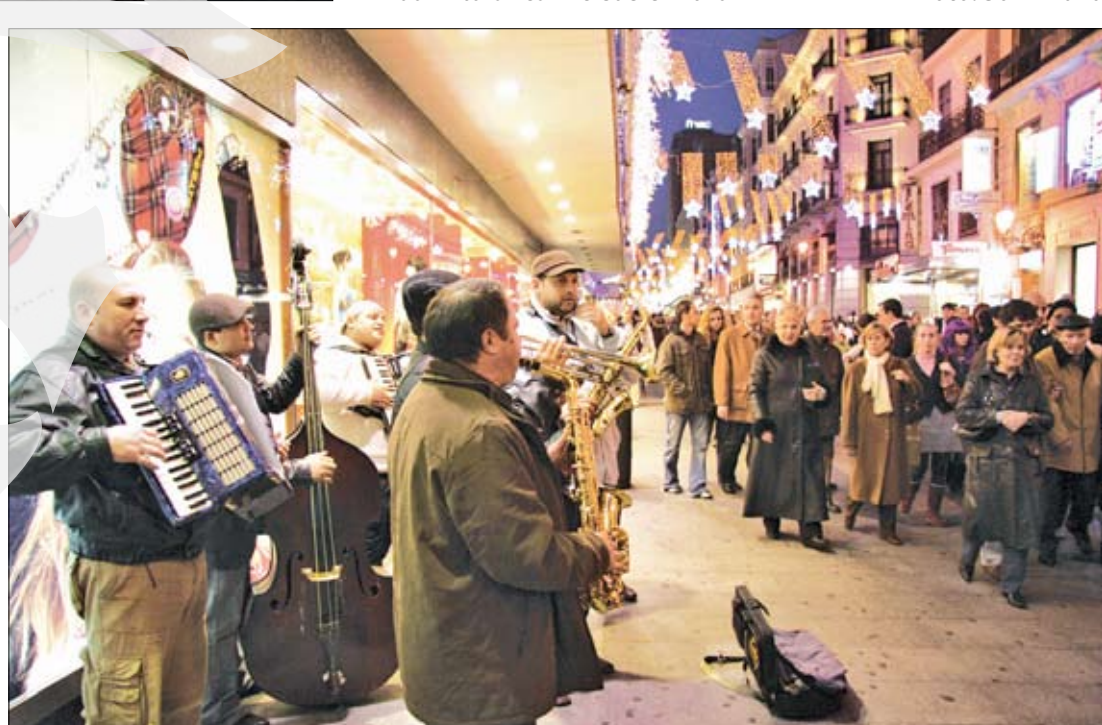
Muzicanți în Madrid

unde locuiesc sute de români. Niciunul dintre ei nu cunoaște vreun conațional venit la furat sau cerșit. La început, acum cinci-șase ani, munciau câte 14 ore pe zi pentru 15 euro. Acum, cei mai mulți au propria afacere, mai mică sau mai mare și sunt foarte mulțumiți. Grija zilei de mâine are alte dimensiuni. Doar dorul de cei de acasă se stinge mai greu... Iar sărbătorile răscolesc răni adânci. În ultima noapte din an, spre ora 11,00 a Madridului și miezul nopții în România, vorbesc la telefon cu rudele din țară. Fiecare a lăsat în urmă un părinte bolnav, un copil cu multe întrebări, o soție singură... Unii reușesc să își ascundă o lacrimă în colțul ochiului, deși tristețea se înclătează în priviri. Alții plâng în hohote preț de câteva clipe: încă un an, încă o pro-