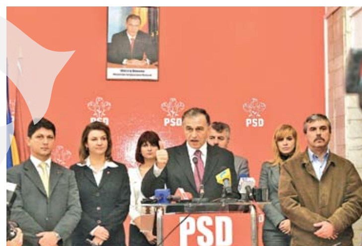
Strâns uniți în jurul șefului, Mircea Geoană

PSD Galați a fost scutit de fricțiunile de la nivel național, fricțiuni care l-au făcut pe liderul Mircea Geoană să spună: „mai bine un partid viu, decât unul de yes-man-i!”. Pe canicula verii, sute de social democrați au înfruntat cu stoicism cele peste 50 de grade Celsius din sala fără aer condiționat a Muzicalului pentru a-l realege președinte la municipală pe Dumitru Nicolae. „Domnul președinte Mircea Geoană vă transmite salutarile sale. A făcut o mare excepție că m-a lăsat să ajung la Galați, să fiu cu dvs. Niciun alt parlamentar nu are voie să părăsească Bucureștiul, și cei care sunt la Bruxelles au fost chemați. I-am spus că este importantă prezența mea aici pentru că sunteți o organizație extraordinară de puternică și meritați toată atenția și toată considerația din partea conducerii partidului”, le-a spus Dan Nica participanților. PSD Galați a fost ferm de partea pensionarilor. Motiv pentru care, în campania pentru europarla-