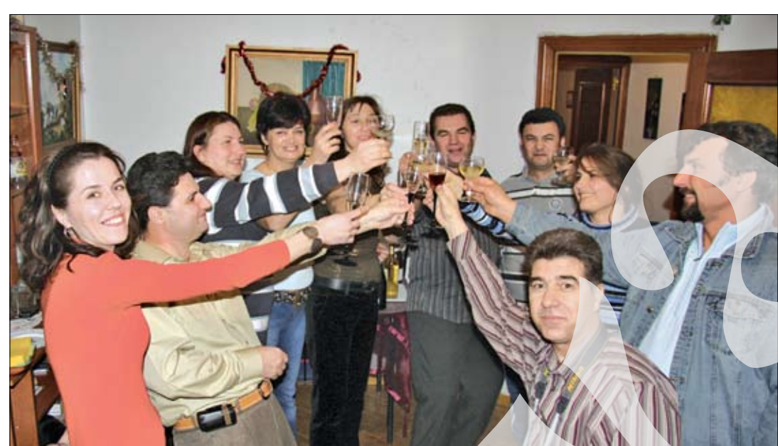
Petrecere între români

țește în ultimele zile ale anului, cu toate că spaniolii lucrează inclusiv pe 31 decembrie, când magazinele sunt deschise până la ora 20,00, iar cozile se întind pe alocuri pe câteva zeci de metri - dar nu durează mult, pentru că întotdeauna există măruntș pe care clientul nu e nevoit să îl adune de pe teșghea (niciodată nu se oferă rest gumă de mestecat, iar cenții se primesc în mână). Belenul - tradiționalul aranjament de Crăciun, cu ieslea, Maica Domnului cu pruncul, mieii și magii - aduce aerul de sărbătoare în fiecare magazin, în fiecare casă, încă de la mijlocul lunii decembrie, iar locurile unde se împodobește și bradul sunt puține. Illuminatul ornamental este însă o feerie, fiecare stradă având "podoabe" diferite, de la clasicii îngerași, lumânări și stelute,