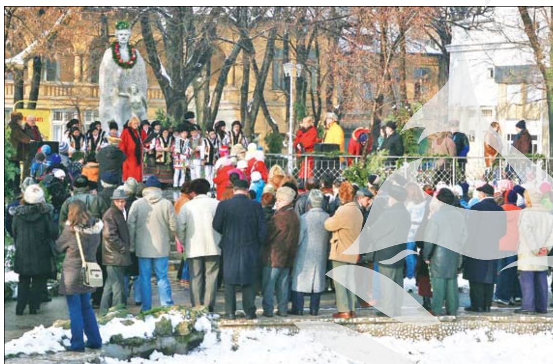
Gălățenii - mai mulți ca niciodată la statuia poetului

Or fi având botoșănenii primul lui bust, dar numai la Galați Eminescu iese din stâncă (simbol al eternității creației sale) și are alături muza (simbolul geniului său) căreia, în fiecare an, îi este ruptă făclia... Membrii Ansamblului