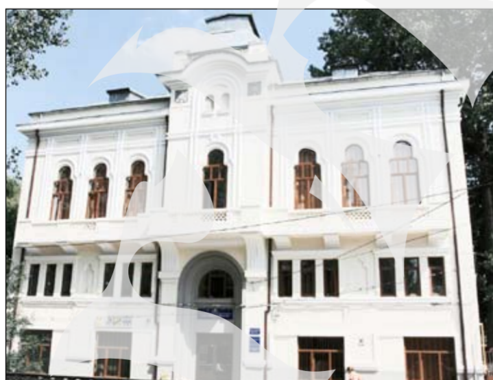
Sediul Casei Corpului Didactic Galați a fost renovat anul trecut cu șase miliarde de lei vechi de la bugetul de stat

Cele zece Centre de Documentare și Informare din instituțiile de învățământ vor fi deschise până la sfârșitul anului școlar