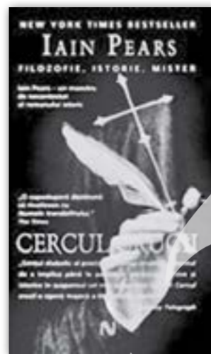
Iain Pears, "CERCUL CRUCII" Editura Nemira, 2007

Aproape o mie de pagini culese cu corp mic, înfățișând o perioadă tulbură din medievalitatea Angliei (epoca post-elisabethană), un polier istoric cu de toate (crime, răsturnări de situații, experiențe esoterice, conflicte religioase) – acesta este, în mare, romanul profesorului și doctorului în filozofie și istoria artelor la Oxford, Iain Pears, socotit, prin amploarea cunoștințelor și talent epic, un demn urmaș al lui Umberto Eco. Modelul construcției sale este, desigur, „Numele trandafirului”, la structura căruia adaugă, alături