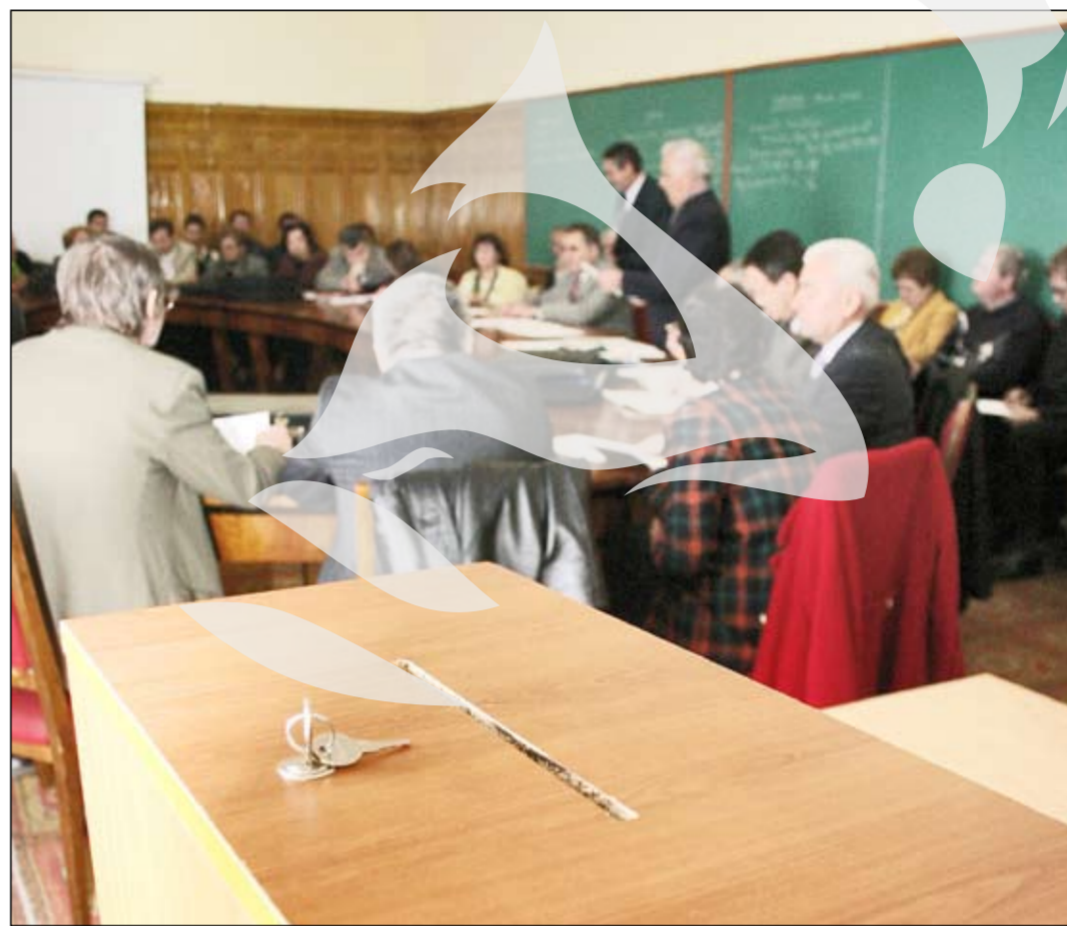
Tinerii din Universitate au găsit „cheia” de la urna alegerilor

Schimbările la nivel administrativ din Universitate vor duce,