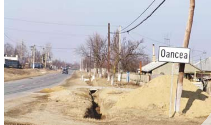
Oancea - "Satul European" fără apă, gaze, canalizare și proiecte europene