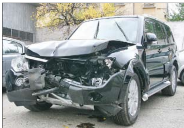
Mașină, viteză, copac. Acesta e rezultatul