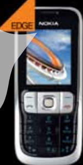
Nokia 2630 22 EUR (TVA inclus)