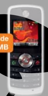
Motorola W230 10 EUR (TVA inclus)