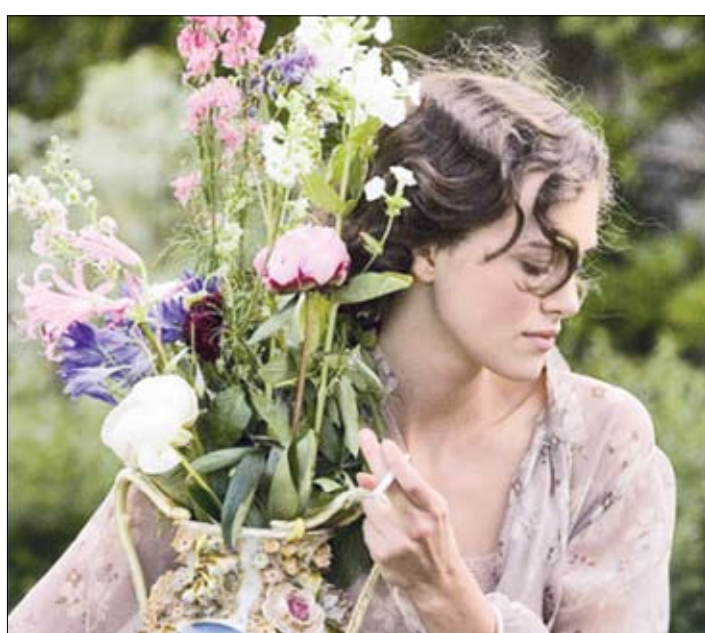
Keira Knightley - scenă din filmul "Atonement"

Drama "Remușcare/Atonement", în regia lui Joe Wright, cu Keira Knightley și James McAvoy în rolurile principale, a fost desemnată, duminică seara, cel mai bun film, la Gala de decernare a premiilor BAFTA 2008, unde a avut nu mai puțin de 14 nominalizări. Trofeul obținut la Londra vine după un șir lung de alte premii importante ale industriei mondiale de film primite de această producție, printre ele aflându-se și Globul de Aur pentru cel mai bun film, primit pe 14 ianuarie. De asemenea, drama britanică are șapte nominalizări la ediția cu numărul 80 a premiilor Oscar, care se vor decerna pe 24 februarie, la Los Angeles.