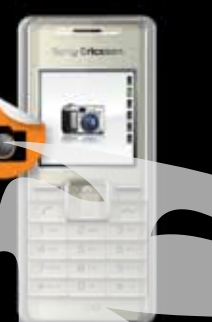
Sony Ericsson K200i 1 EUR (TVA inclus)