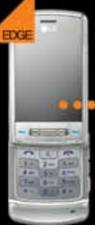
LG Shine 89 EUR (TVA inclus)