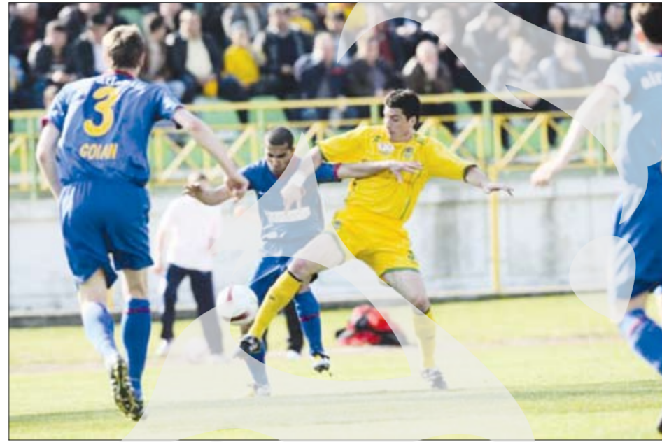
Dispută pentru balon și pentru trei puncte uriașe, necesare ambelor echipe. Până la urmă a câștigat Steaua, cu 1-0

► Unirea Urziceni - Farul Constanța 0-0. Al doilea scor alb înregistrat sâmbătă, care demonstrează eclipsa de formă în care se află cele două grupări. Acest 0-0 nu prea folosește cine știe ce vreunei echipe. Farul a rămas tot sub linia retrogradă-