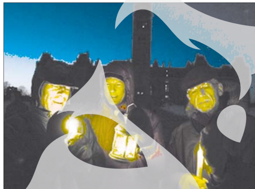
60 de minute, pe întuneric

A treia ediție a acestui proiect va avea loc pe 28 martie 2009.