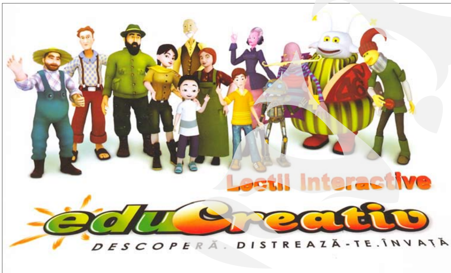
Câteva dintre personajele „aduse la viață” de EduCreativ pentru a-i ajuta pe copii să se bucure de fiecare descoperire.

Părinților care nu au deplină încredere în eficacitatea învățământului informatizat le spunem că lecțiile pe calculator nu sunt asemenea jocurilor video, care pot conține scene de violență și care, jucate în exces, duc la dependență. Pachetele educative gălățene sunt produsul unei colaborări de durată între Altfactor și învățători și profesori experimentați.