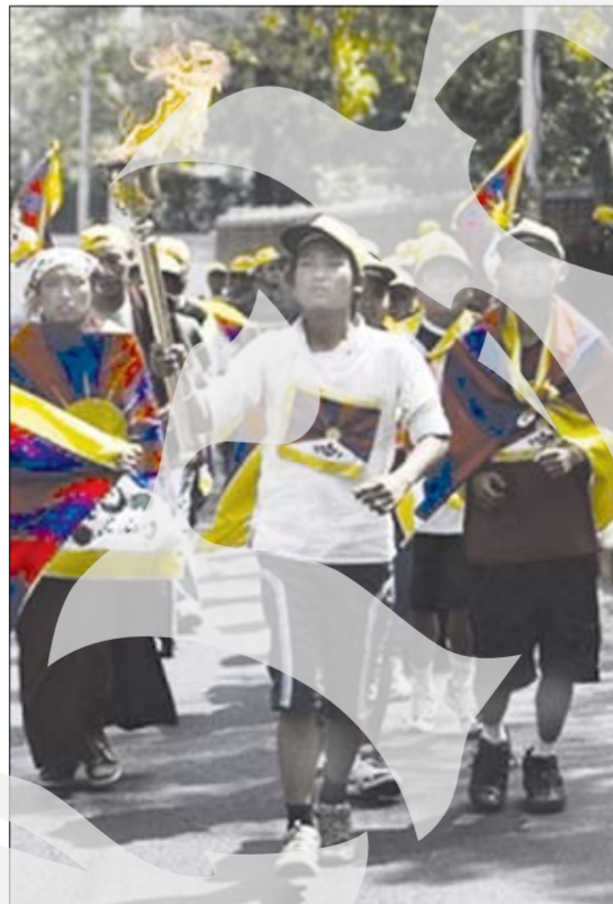
"Flacăra independenței", la New Delhi

Dalai Lama, liderul spiritual al tibetanilor aflat în exil, a anunțat sâmbătă că vrea să aibă mai mult timp pentru a se pregăti pentru "viața viitoare" și că ar putea, peste câțiva ani, să renunțe la rolul său politic. "Este posibil ca peste un timp să renunț complet, voluntar și cu bucurie", a declarat Dalai Lama, în cadrul unei conferințe, fără a oferi