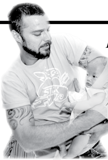
Cântărețul portorică, în Cambogia

Virgil Guriuianu * Iași, Editura Polirom, 2008.