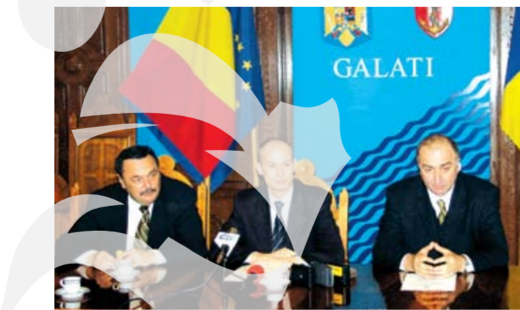
Ca să revină în echipa liberalilor, prefectul trebuie să demisioneze din funcție