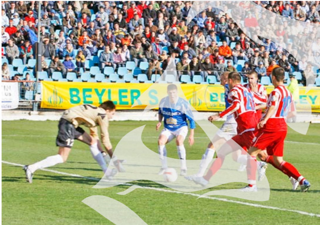
Pentru a-și apropria cele douăsprezece puncte impuse de conducerea clubului, „oțelarii” trebuie să aștepte în haită și să se apere în aceeași manieră

Înfrângerea din etapa precedentă, 1-2 cu „U” Cluj, îl face pe șeful „oțelurilor” să fie sceptic în privința umplerii stadionului la