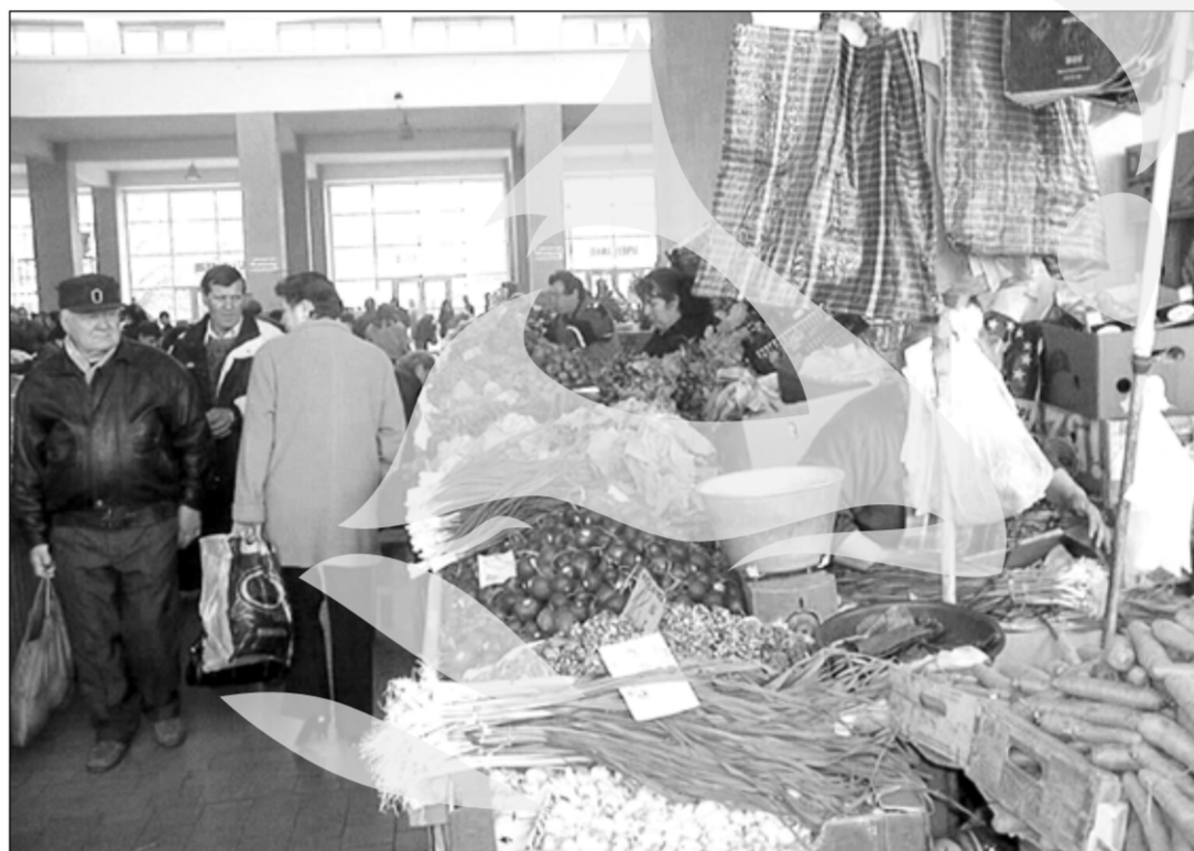
Legumele - atracția primăverii

O surpriză neplăcută ne oferă ceapa uscată, care a sărit de la 1,50 lei kilogramul, săptămâna trecută, la fix doi lei kilogramul și nu se știe dacă se oprește aici, în ciuda că noul generație verde îi sufocă spațiul vital. Morcovii stagnează la doi lei kilogramul, celelalte rădăcinoase – țelina, pătrunjelul, păstârnacul, etalându-se pe o plajă mercurială cuprinsă între trei și patru lei kilogramul. Și varza roșie a sărit, de la 2,50 la trei lei kilogramul, dar e bine că staționează cartoful, cel mai scump fiind 1,50 lei kilogramul, iar cel mai ieftin coborând și sub un leu kilogramul. Se mai pot cumpăra, din import, vinete, cu 4,50 lei kilogramul, ardei grași cu nouă lei kilogramul sau conopidă cu cinci lei kilogramul. Ciupercile sunt două