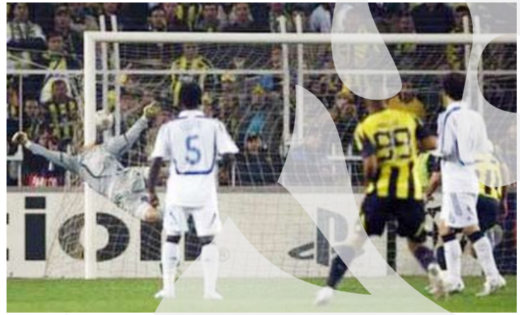
Chelsea s-a impotmolit în Turcia aprilie, la Tg.Mureș. RC Strasbourg, într-un meci din etapa a 31-a a campionatului Franței.

▶ Reprezentativa de futsal a României a încheiat la egalitate, scor 1-1, meciul cu Cehia, disputat în deplasare, în prima manșă a barajului de calificare la Campionatul Mondial ce va avea loc în Brazilia, în perioada 30 septembrie - 19 octombrie. Partida retur se va disputa pe 16