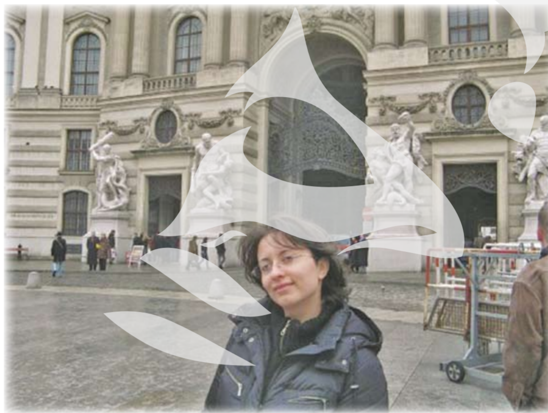
"Ți trebuie mai mult de două zile să vizitezi Viena"

Pentru perioada petrecută în Viena voi alege varianta scurtă. Am ajuns în Viena, am căscat gura la mai tot. E raiul celor împătimiti de "chietroaie" (cum le numesc eu, în dulcele grai moldovenesc), adică rubine, safire, diamante, din categoria asta... În imensul Palat Hofburg am văzut în prima zi colecția regală de argintărie și porțelan, plus camerele lui Franz Josef și ale împărătesei Sissi. A doua zi, tot în Hofburg, bijuteriile coroanei, în varianta austriacă Habsburgică. Apoi Muzeul de Artă, pentru o expoziție Arcimboldo, artist italian cunoscut mai ales pentru picturile sale în care combină elemente naturale (fructe, animale, pești, obiecte) pentru a crea fete umane. Aveam și câteva picturi de Pieter Bruegel cel Bătrân, unul dintre pictorii mei