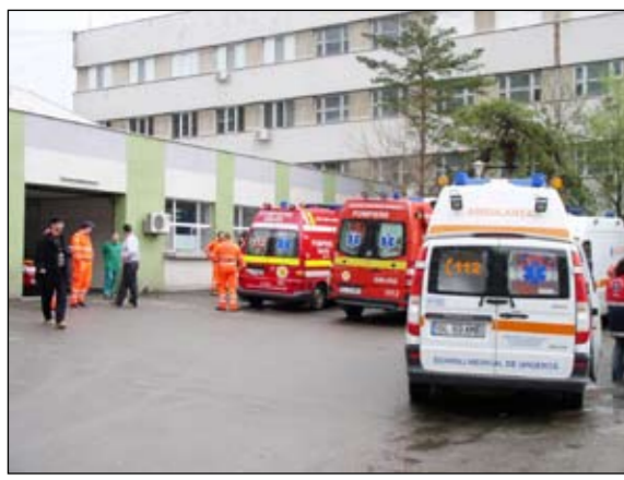
Gălățenii s-au întors de la summit