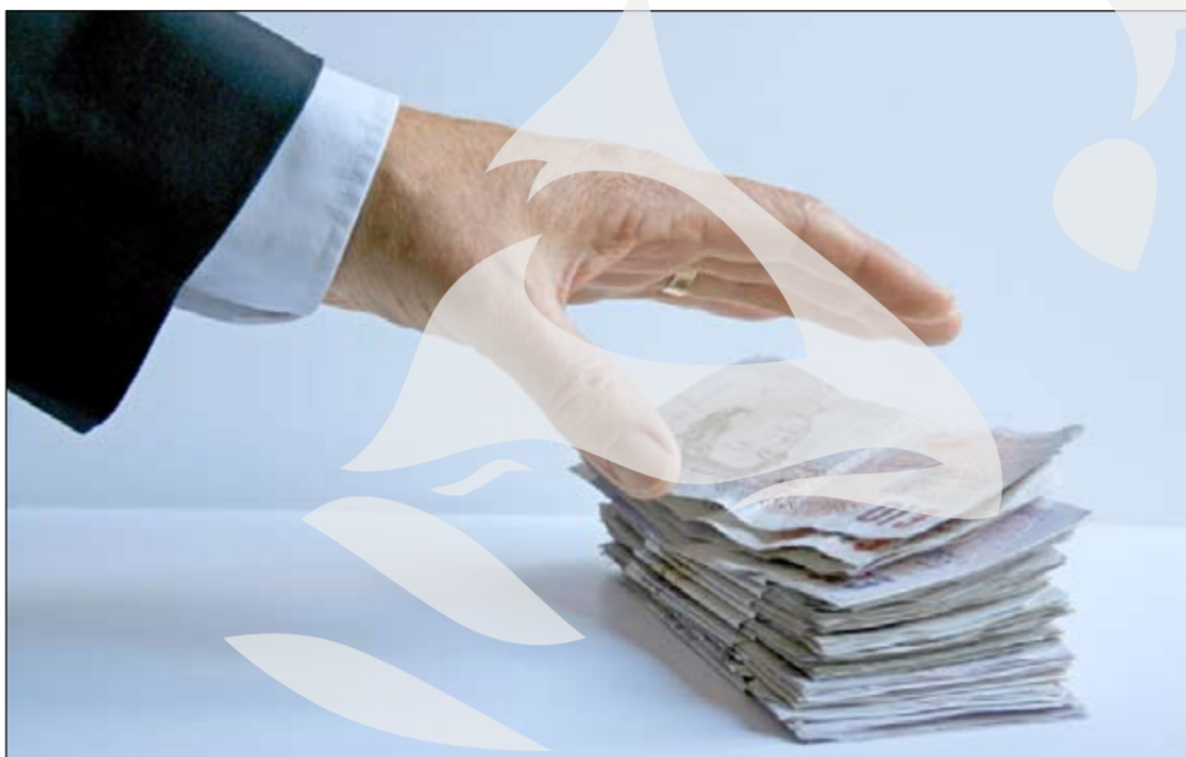
Dacă știți să cerți, pui mâna pe ei!

Beneficiarii eligibili sunt persoane fizice autorizate sau juridice române, care se ocupă cu agricultura (Certificat eliberat de Registrul Comerțului), a căror exploatare este situată pe teritoriul țării, are o valoare economică