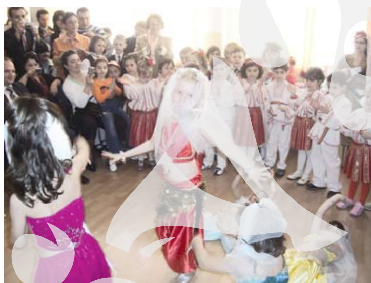
Costume tradiționale turcești, adaptate și pe măsura prichindeilor de la Grădinița „Parfumu! Teilor”

Ieri, la Școala Nr. 43 „Dan Barbilian”, în prezența atașatului Consulatului Turciei de la Constanța, doamna Nedime Yalçin, a fost lansat un proiect cultural pentru tinerii gălățeni. Cursuri gratuite de limbă și cultură turcă, aceasta este provocarea salutăată de oficialul consular, adresată elevilor de către Centrul de Cercetare, Dezvoltare, Educație și Cultură „Dunărea de Jos” - Uniunea Democrată Turcă din România, filiala Galați, și de președinta acesteia, Gulten