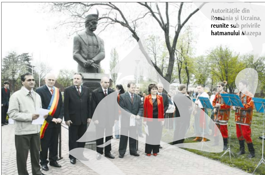
Autoritățile din România și Ucraina, reunite sub privirile hatmanului Mazepa