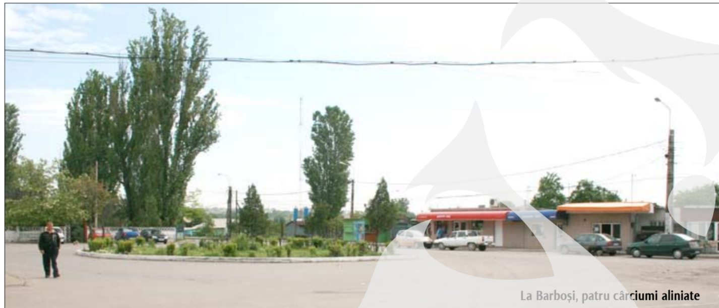
La Barboși, patru cărciumi aliniate

Sunt născută în acest cartier, acum 50 și ceva de ani și în afara asfaltării podului de la Cătușa și până în gară, nimic altceva demn de luat în seamă nu s-a făcut pentru acest cartier. Scuzați! Avem patru cărciumi prin bunăvoința primăriei, în 1000 mp, apă curentă, canalizare, farmacie, biserică nu avem. Pentru o sfințire la casă, o moliftă pentru o lăuză sau un botez trebuie să mergem la Movileni, de parcă am fi sat Barboși, comuna Șendreni. Ce este până la urmă Barboșiul? Sat sau cartier? Plătim taxe și impozite, dar nu avem trotuare, dacă plouă și trece o mașină trebuie să te urci pe gard să nu te murdărească. Acum patru ani s-a pus ceva piatră pe anumite străzi cu promisiunea că se vor amenaja în continuare. Pace ție, muritorule! Străzile s-au înălțat, iar apa de la ploii intră în curți și case. Nu sunt