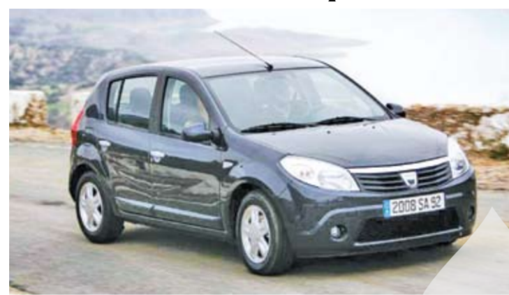
Primele mașini Dacia Sandero vor fi livrate luna viitoare

Dacia va lansa în România modelul în două volume Sandero la 3 iunie, iar comenzile pentru mașină vor putea fi preluate după lansare, astfel încât primele livrări către clienți vor fi realizate la sfârșitul lunii iunie, au declarat, ieri, oficialii ai companiei. Dacia