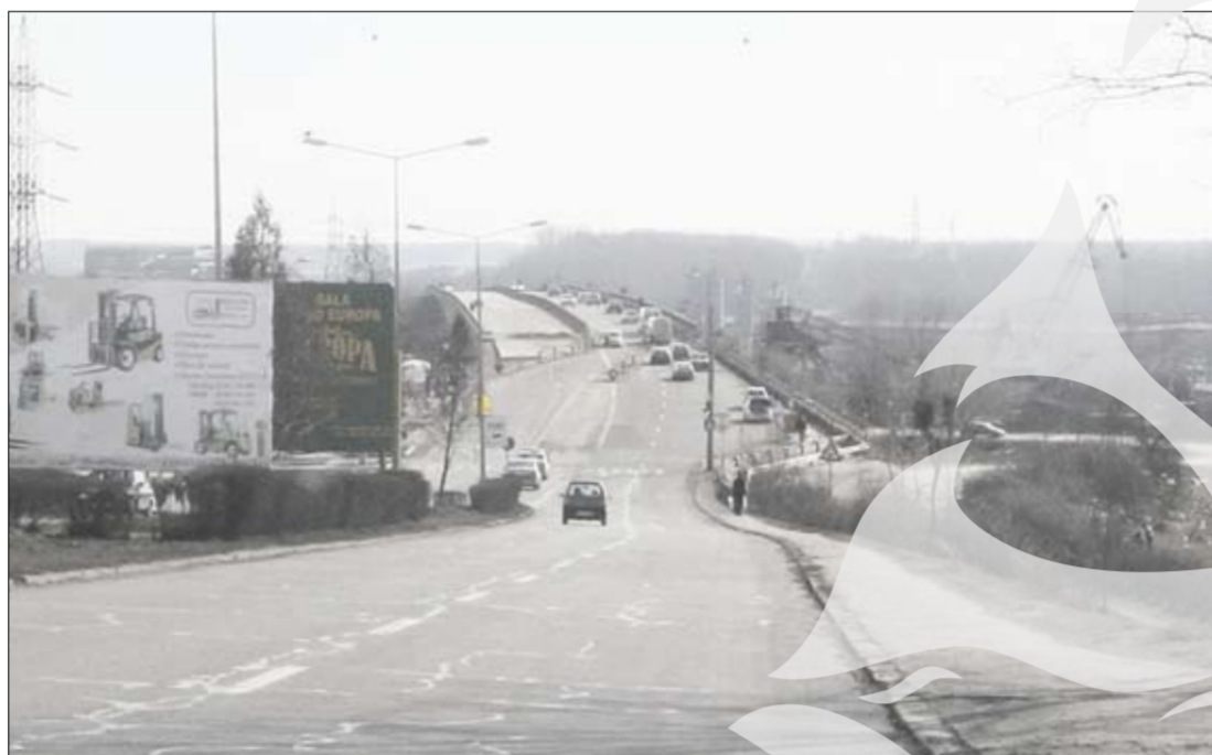
Podul rutier de peste Siret

Imediat după accident, șoferul a părăsit zona, încercând să se sustragă de la cercetări. În scurt timp a fost identificat și reținut. Procurorii Parchetului de pe lângă Judecătoria Galați au făcut propunerea pentru arestare preventivă. La instanță,