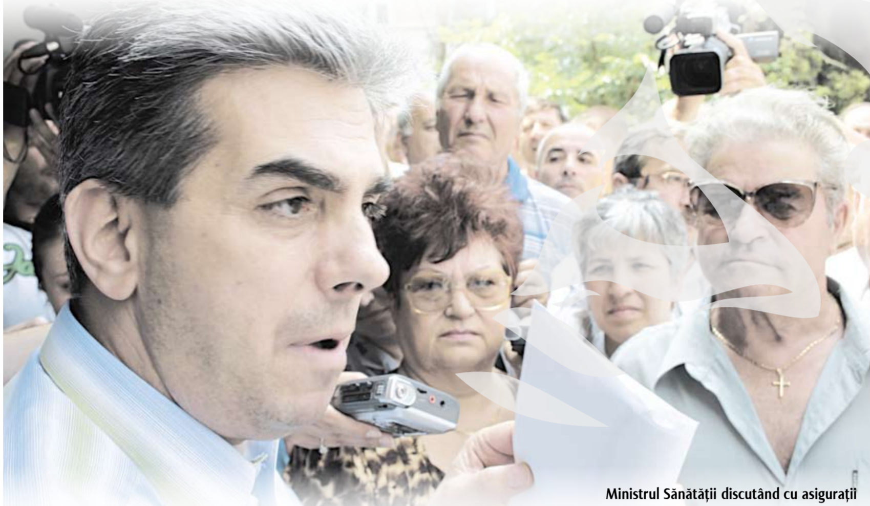
Ministrul Sănătății discutând cu asigurații

≡ Farmaciile nu mai au stocuri din unele produse farmaceutice ≡ Unele medicamente nu se mai găsesc nici căutate de farmaciști la mai multe depozite ≡ Bolnavii refuză „similarele” românești ≡ Farmacia Spitalului Județean încă mai face față