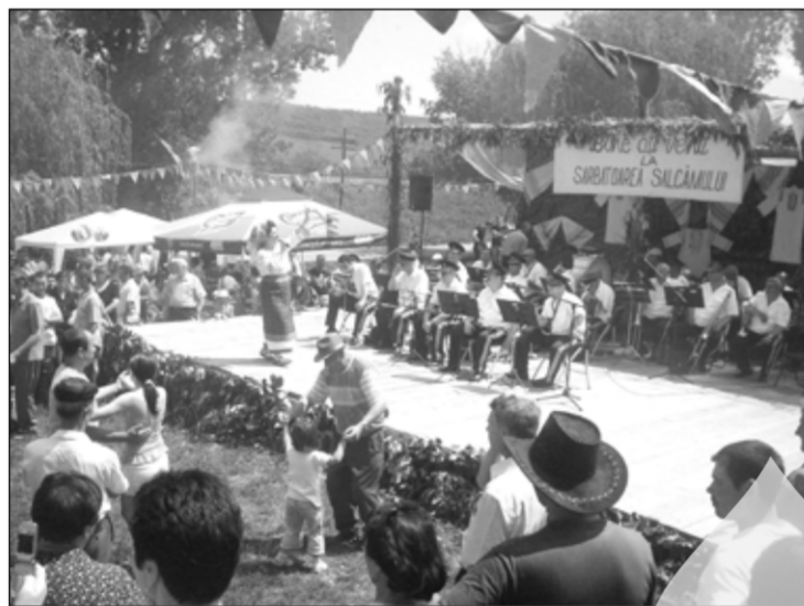
O dată pe an, toate drumurile bereștenilor duc la „Izvorul Căprioarei”

Salcâmbii, înflorire maximă. Lumea din târg și din satele apropiate, lăsând la o parte aite interese, a intrat în jocul primăriei, începând, de pe la ora 10.30, transformarea „Izvorului Căprioarei” în centrul vital al zonei. Fum de tămâie din cădelnițele preoților invitați să purifice amiaza, răspândit spre vile de la Zgârcaci și Autogara „Dumony”, șefi de la Galați, fanfara Centrului Cultural „Dunărea de Jos”... Banda sonoră, în suprasarcină. Mici făgăduitori de vremuri mai bune, bere, electorat felurit. Încuțată ca una din edițiile sale strălucite, „Sărbătoarea Salcâmbului” de duminică trecută a păcătu