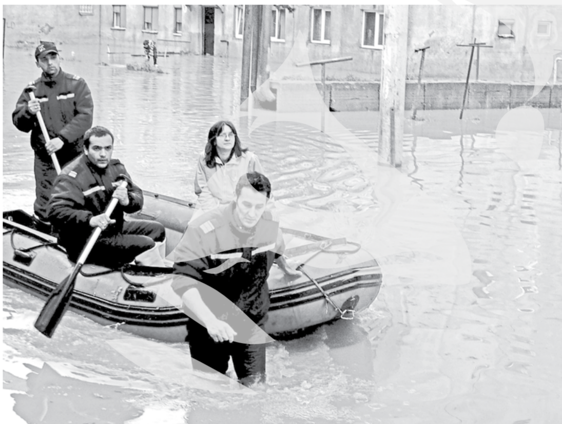
Petroșani - "Mica Veneție"

O vijelie a afectat, duminică după-amiază, acoperișurile a peste 35 de case din localitățile Petricani și Țibucani, din județul Neamț, un localnic a fost luat de vânt și proiectat într-un pod, iar zece stâlpi de susținere a cablurilor electrice și zeci de arbori au fost culcați la pământ. De asemenea, zeci de hectare de teren agricol au fost inundate.