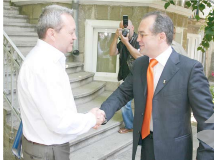
Fiecare șef de partid cu candidatul lui

„Este pentru prima oară după 1989 când PSD este învins de o singură forță politică și aceea este PD-L, care la nivelul Bucureștiului are un avans de două procente față de social-democrați”, a anunțat, victorios, liderul, PD-L Emil Boc. Acesta a precizat că față de 2004, social-democrații au pierdut aproape un milion de voturi politice, pe care le-a câștigat PD-L, Emil Boc a mai precizat că față de 2004, când PD-L avea patru pre-