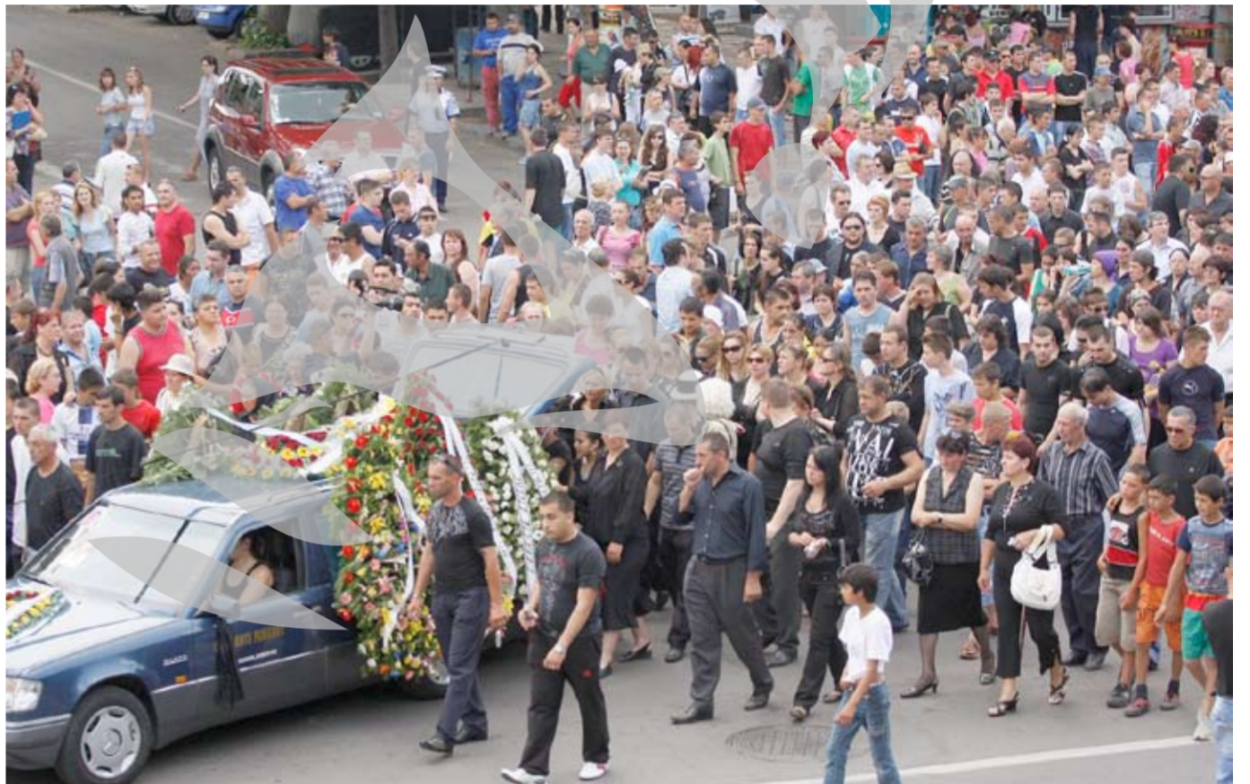
Trafic întrerupt pe strada Siderurgistilor

În sala „Fight Club”, printre muni de flori, într-o atmosferă sumbră, păzit cu vigilență de angajații săi din cadrul firmei de pază, coșciugul victimei asinatului de duminică noaptea a fost permanent înconjurat de familie și prietenii apropiați. Lacrimi au curs neînțecat, momentul scoaterii în curte a corpului neînsușit generând un val greu de stăpânit de durere. Cățărați în copaci, pe acoperișul blocului sau zgându-se prin grățiile unui gard – curioșii nu au lipsit.