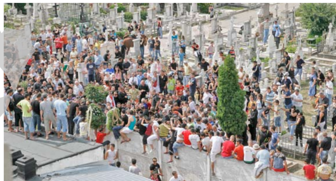
Cimitirul Eternitatea, invadat de miile de participanți la înmormântare

treaga scenă. Vă mai pot spune că ambii au avut un avocat din oficiu pe care astăzi l-au desemnat ca fiind avocat ales”, a susținut președintele Tribunalului Galați, Carmen Sandu.