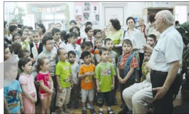
Școala 1 “Nicolae Mantu” și-a lansat revista într-un cadru festiv

Cristina S.Carp