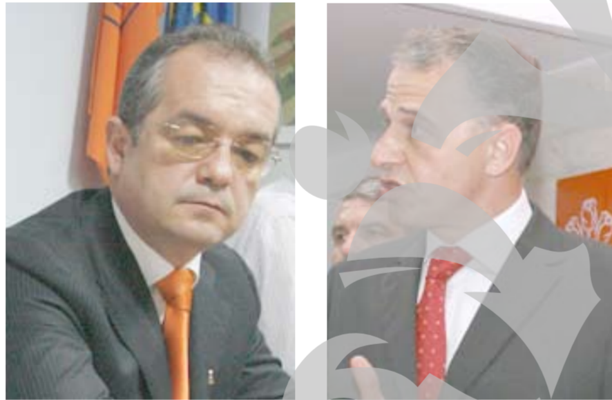
Emil Boc și Mircea Geoană, prezenți în aceeași zi la Galați

Prezența la Galați a celor doi lideri politici naționali – Mircea Geoană și Emil Boc – a făcut, ieri, ca cei doi candidați la primărie să fie adevărate ținte pentru critici „la nivel înalt”.