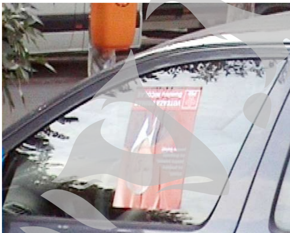
Scandalul afișelor electorale a fost una dintre piesele de rezistență din ziua votului