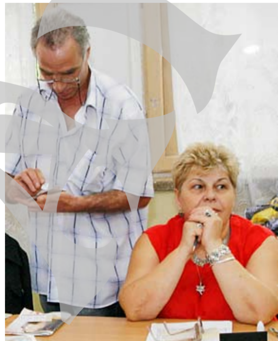
Reprezentanta PC la locul de muncă

Vă mai amintiți de celebrul incident de la Secția 129, unde reprezentanta PC a fost cercetată pentru că a permis unui cetățean să voteze în locul altei persoane? Ei bine, ieri, doamna respectivă era reprezentanta PC la Secția... 130, adică colea, alături. Schimbul de reprezentanți este legal, ne-a asigurat președinta Secției de Votare de la 130, arătându-ne aprobarea BEJ. Conservatoarea ne-a declarat, liniștită, că „nu mai sunt probleme, poliția a încheiat cercetările”, în timp ce distribuia buletine de vot cetățenilor. Deci, totul e bine și frumos, lucru confirmat și de membrii Secției 130 care nu înregistraseră niciun incident până la ora 17.00.