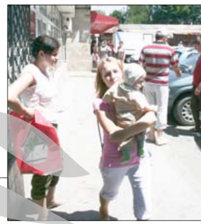
E vară, deci e cald