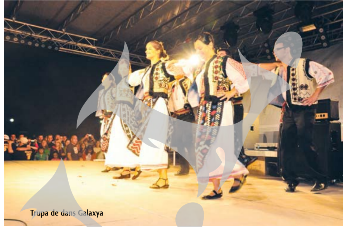
Trupa de dans Galaxy

"Galaxy" - trupa de dans de societate – a dezvăluit câteva dintre secretele ritmurilor salsa, tango și rumba. A fost însă aclamată puternic la final, când s-a dezlănțuit pe melodii autohtone – o serie de sârbe îndrăcite, care