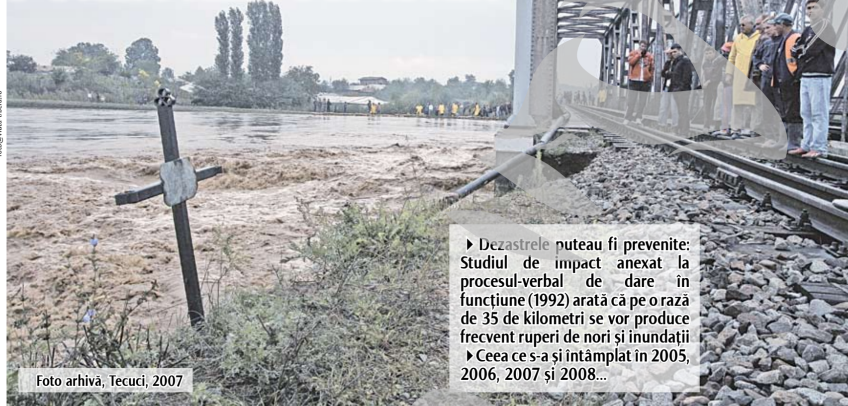
Tecuci, 2007

► Dezastrul puteau fi prevenite: Studiul de impact anexat la procesul-verbal de dare în funcțiune (1992) arată că pe o rază de 35 de kilometri se vor produce frecvent ruperi de nori și inundații ► Ceea ce s-a și întâmplat în 2005, 2006, 2007 și 2008...