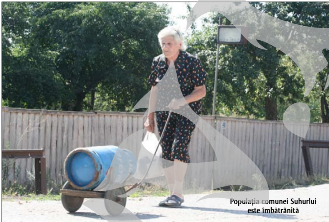
Populația comunei Suhurlui este îmbătrânită

Alimentarea cu apă potabilă este una dintre marile pro-