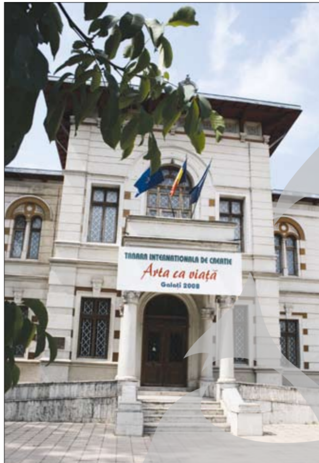
Timpe de zece zile, zece artiști plastici creează în tabăra de la Muzeul de Artă Vizuală

Abia în 2009 am putea avea ceva nou în învățământ Legile Educației zac la minister