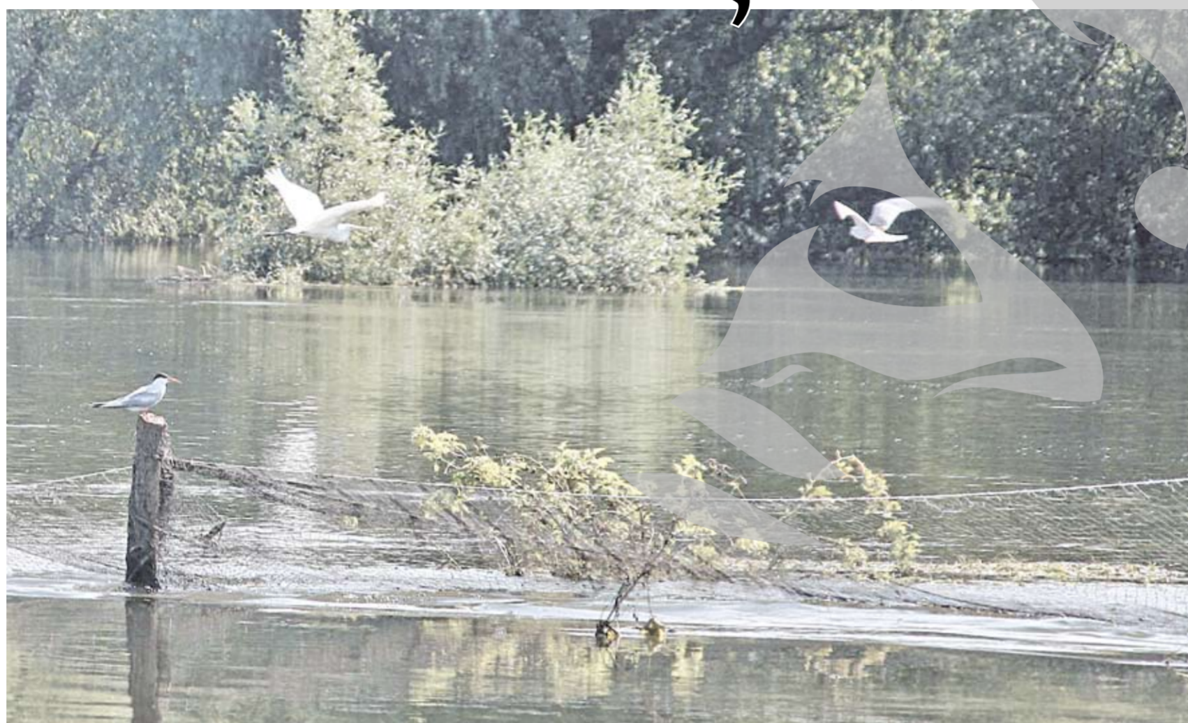
Viitura de pe Prut a produs pagube serioase fermei piscicole