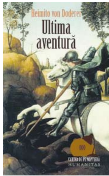
Heimito von Doderer, Ultima aventură. Roman cavaleresc, Editura Humanitas, 2008