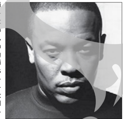
Celebrul rapper e în doliu după fiul său