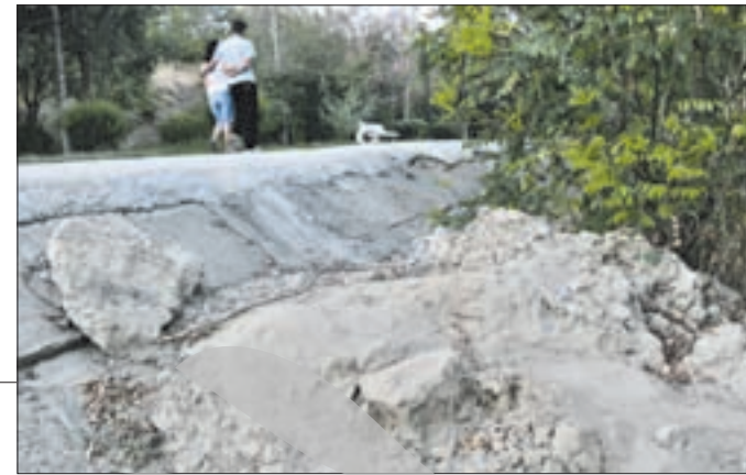
Terasamente făcute de mântuială