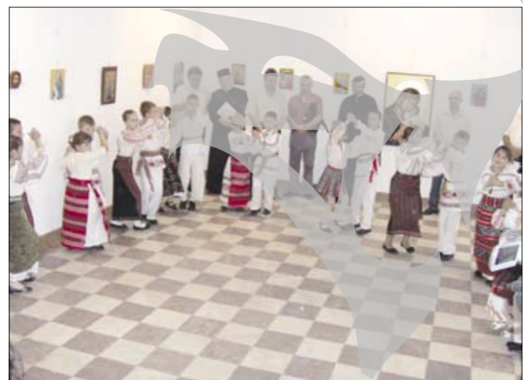
Copiii duc portul popular mai departe