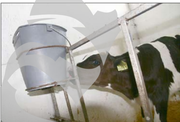
Vițeii, în creșă fermei

pete, adică sana, lapte bătut, smântână. Ne bazăm pe producție sută la sută naturală, dar con-