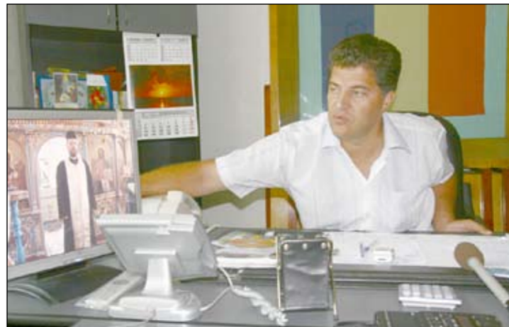
Primarul, mândru de postul local de televiziune

Primarul are propriile sale viciorii. „Schela este o comună foarte tânără, a fost atestată documentar abia în 1895, dar uitați-vă cât de mulți eroi a dat în Primul și