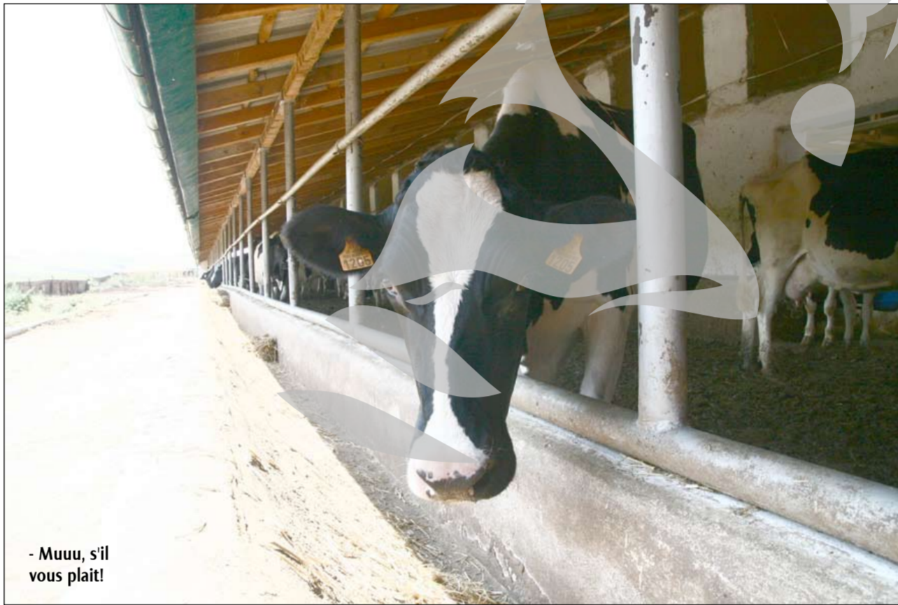
- Muuu, și'l vous plait!

În Schela, odinioară localitate în care creșterea vacilor era o îndeletnicire generală, localnicii au renunțat să își mai plimbe bălțatele de la pășune în curte și invers. Pentru întreținerea unei vaci e nevoie de multă muncă și multă responsabilitate. De unde furaj, când seceta a distrus toate culturile? Iar cei câțiva litri de lapte nu sunt plătiți cum trebuie de colectori, astfel încât țărănilor să le mai convină să se ocupe cu așa ceva. În ciuda acestui lucru, paradoxal, Schela este sursa unor produse lactate biologice, pentru care europenii ar plăti serios, iar de pe pășunea fermei de la Negrea se strânge fân pentru furajarea vacuțelor "Holstein", aduse special din Franța.