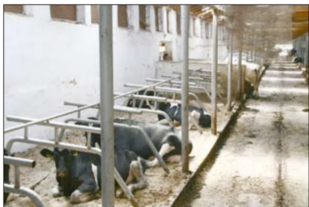
Văcuțele din Franța s-au acomodat la condițiile din România