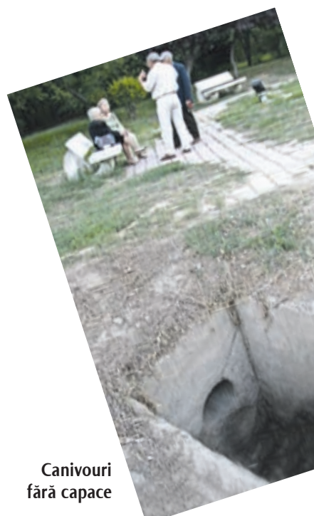
Canivouri fără capace

Am refăcut traseul propus de cititoare și am fotografiat cele semnalate. Acum este ușor să ia cineva măsură. Succes!