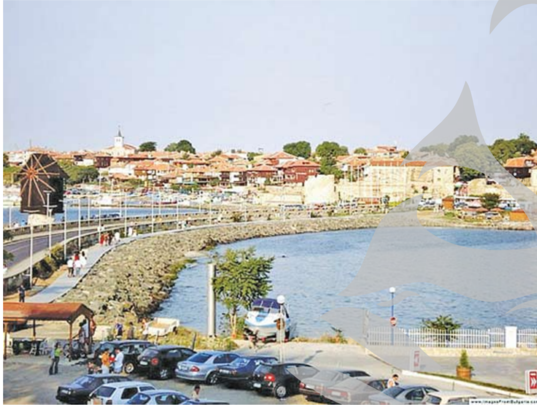
Bulgaria, all-inclusive și la transport. Te duci cu mașina, te întorci cu trenul

administrația hotelului au refuzat să le acorde sprijin, cu toate că autoturismul fusese furat din parcare hotelului, iar pentru locul de parcare respectiv plătesc o taxă suplimentară.