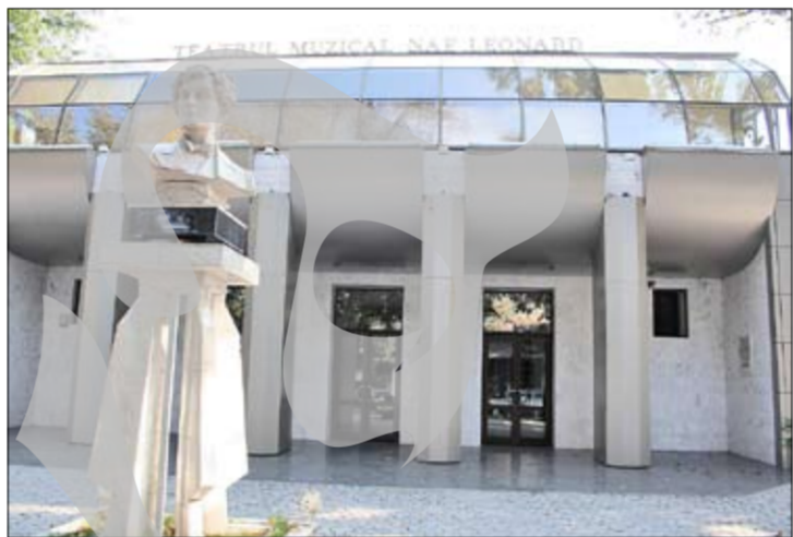
Teatru Muzical "Nae Leonard"

Așadar, septembrie va fi o lună a premierelor de teatru. Gălățenii au așteptat câteva luni, însă așteptarea - sperăm - a meritat.