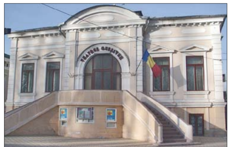
Teatru de Păpuși "Gulliver"