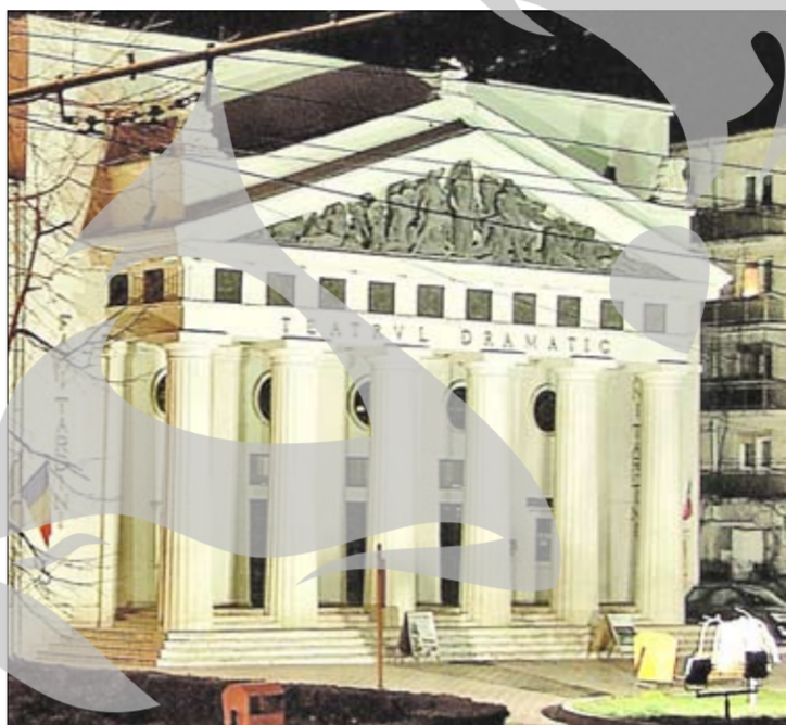
Teatru Dramatic "Fani Tardini"