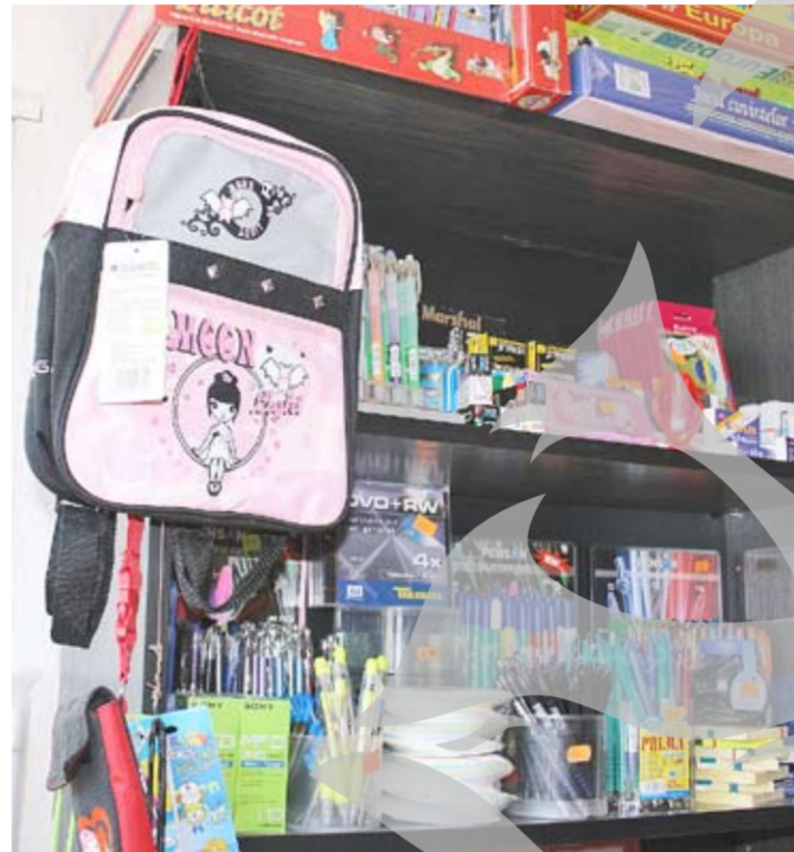
Și copiii de grădiniță au ghiozdan pe măsura lor

Directoarea Librăriei „Bon ami” spune, la rândul său, că, într-adevăr, față de anul trecut copiii și-au personalizat foarte mult cerințele. „Sunt la mare căutare seturile cu personaje din desene animate. Nu avem doar ghiozdan cu Spiderman, Jetix, Candy sau Shrek, dar și pixuri și stilouri im-