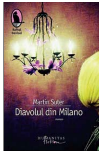
Martin Suter, "Diavolul din Milano" Editura Humanitas Fiction, 2008