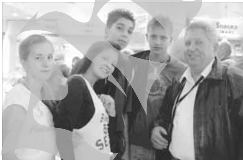
Delegația Liceului cu Program Sportiv Galați a reprezentat România la "Euroschoools Youth Camp" 2008

Tabăra internațională „Euroschoools Youth Camp” 2008 a fost organizată, la mijlocul lunii septembrie, de Austria și Elveția, țări care au găzduit Campionatul European de fotbal din acest an. Delegația de elevi și profesori din cele 53 de țări participante la acest campionat au fost invitate în cele două țări la numeroase activități sportive, dar și culturale.