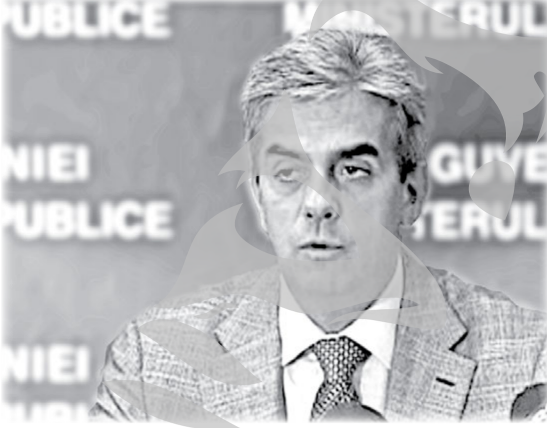
Ministrul Sănătății Eugen Nicolăescu

În vederea asigurării continuității eliberării medicamentelor cu și fără contribuție personală pentru tratamentul în ambulatoriu, precum și a medicamentelor și materialelor sanitare care se acordă pentru tratamentul în ambulatoriu al bolnavilor incluși în unele programe naționale de sănătate cu scop curativ, casele de asigurări de sănătate pot utiliza angajamente legale suplimentare în anul 2008, în limita prevederilor aprobate în bugetul fondului pentru exercițiul bu-