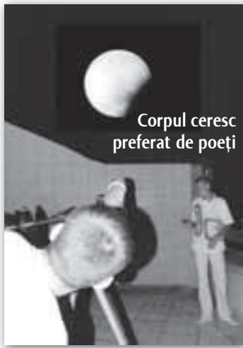
Corpul ceresc preferat de poeți