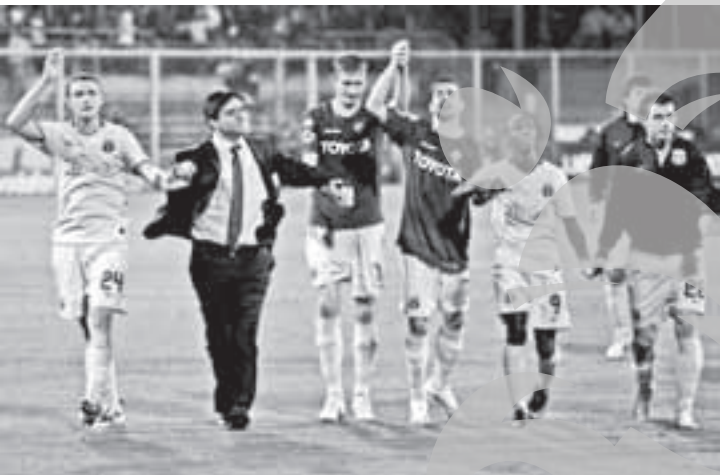
E bun și un 0-0 cu echipa lui Mutu...

► Rezultate înregistrate în partidele disputate marți, în etapa a doua a fazei grupelor Ligii Campionilor . Grupa E: Aalborg - Manchester United 0-3, Villarreal - Celtic Glasgow 1-0. Grupa F: Fiorentina - Steaua București 0-0, Bayern Munchen - Olympique Lyon 1-1. Grupa G: Arsenal - FC Porto 4-0, Fenerbahce - Dinamo Kiev 0-0. Grupa H: Zenit Sankt Petersburg - Real Madrid 1-2.