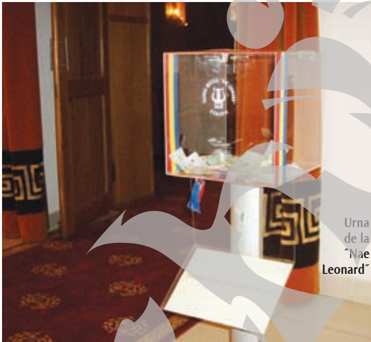
Urna de la „Nae Leonard”

Fundația cu numele marelui pictor strânge ban cu ban