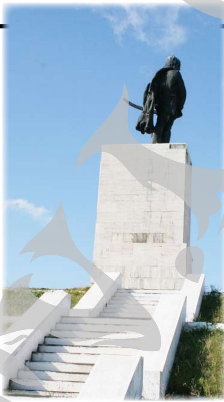
Vodă - cu spatele către prezentul sumbru

Dar să ne întoarcem la statuie. Monumentul lui Ioan Vodă cel viteaz pare de două ori condamnat la uitare. Ce-i drept, inaugurarea lui, în anul 1974, deci în plin avânt socialist, a fost transformată cu grijă într-un prilej de propagandă. „Pionierii” și „șoimii patriei” au fost duși ani de zile „să depună jurământ” la monument. Ce mai conta că istoria era din start mistificată? Căci locul statuii a fost declarat chiar locul unde Ioan Vodă a pierdut cea din urmă luptă cu turcii - la Roșcani