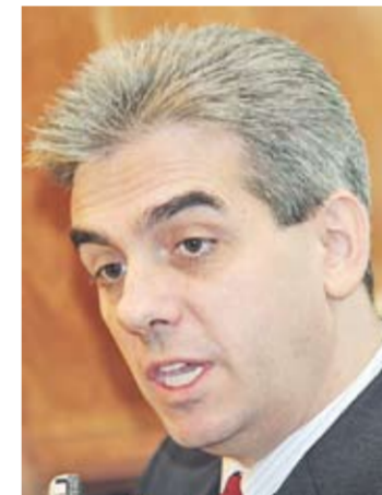
Ministrul Eugen Nicolăescu

medicamentului. Pentru alegerea prețului CIP am hotărât să luăm în calcul media celor mai mici prețuri din 12 țări ale UE, cu o reducere de 5 la sută, astfel că prețul în valută va scădea cu 6,82 la sută la medicamentele de pe toate listele de compensate”, a explicat ministrul Sănătății Eugen Nicolăescu, la finalul întâlnirii cu reprezentanții ARPIM. El a spus că această recalculare nu va afecta fondul național unic de asigurări adică bugetul pe 2008.