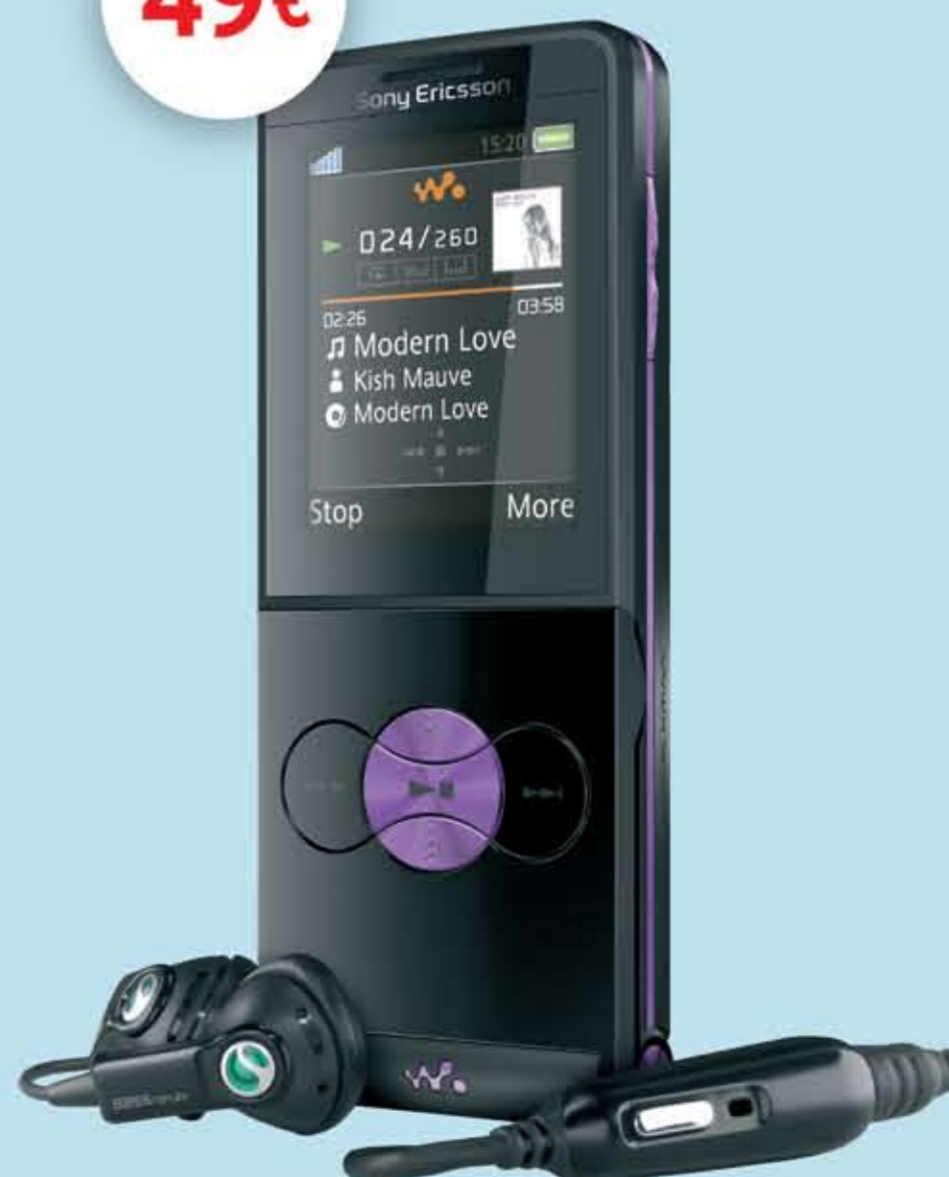
Sony Ericsson W350i