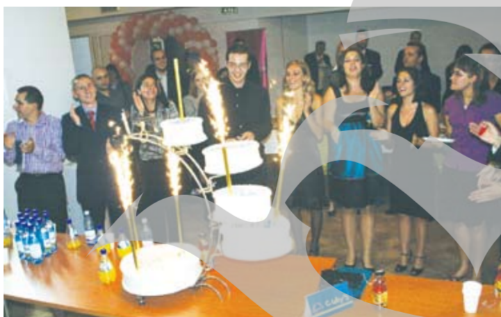
Tortul AIESEC a fost însoțit de tradiționalul „La mulți ani!”

tența, vreme de aproape o oră, prezentând tehnici de convingere a partenerului, tehnici de manipulare, elemente de analiză tranzacțională pe care le-am putut regăsi chiar în discursurile și în desfășurarea evenimentului de vineri seară, semn că membrii AIESEC își însușesc repede lecția. A urmat apoi o ceremonie de numire a noilor „alumni” (membri ai organizației care au „absolvit” cursurile AIESEC), precum și de premiere a celor mai implicați alumni. Rând pe rând, au venit în fața invitaților aproape toți cei care, într-un fel sau altul, au avut o contribuție la dezvoltarea AIESEC Galați în ultimii ani. A urmat apoi încă un moment festiv, în care au fost premiate cele mai importante companii și instituții care au sprijinit activitatea tinerii organizații studențești gălățene. Printre cei premiați s-a numărat și cotidianul „Viața liberă”, care a primit o distincție pentru promovarea AIESEC Galați în toți anii de existență a acestei organizații. Nu putea lipsi nici momentul festiv, în care membrii AIESEC au venit cu un tort uriaș, pe care l-au „devorat” toată noaptea, la o petrecere de neuitat în Club S.