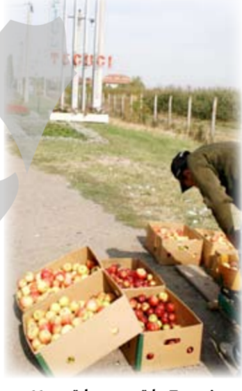
Mere „de șosea” la Tecuci

Producția de mere a acestui an este estimată la numai 700 de tone, ceea ce înseamnă pu-