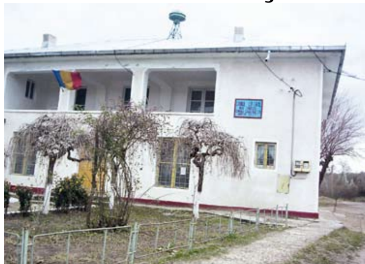
Numele inimii artistice a Văii Horincei - Căminul Cultural Cavadinești

Câteva zile ne mai despart de Sărbătoarea cântecului și jocului popular horincean, manifestare artistică ajunsă, după numerotarea de după 1990, la ediția a XIII-a. În ultima duminică din lună, la Căminul Cultural Cavadinești, va fi iarăși animație. În comparație cu anii precedenți însă, pregătirile sunt ceva mai temperate, căci de unde fonduri pentru a acorda premii, pachetele cu de-ale gurii, pentru oaspeți, și cheltuielile cu protocolul? S-ar putea ca lingurile de lemn din inventarul căminului cultural să rămână nefolosite. Pentru public, importantă rămâne scena, spectacolul în sine. Acesta va depinde și de aportul celorlalte cămine culturale din județ. Se contează, ca în fiecare an, pe prezența artiștilor de la Rogojeni,