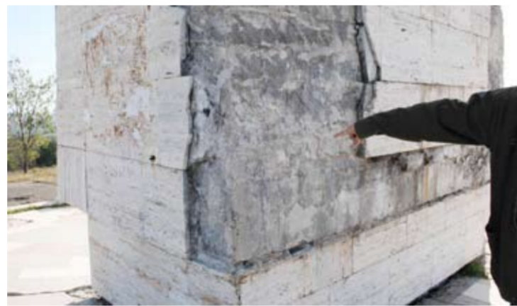
Se pare că se caută marmura...