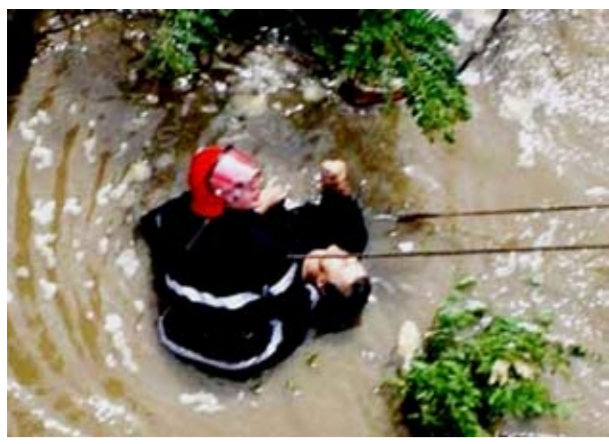
Accidentul de sâmbătă noaptea, de pe Dig