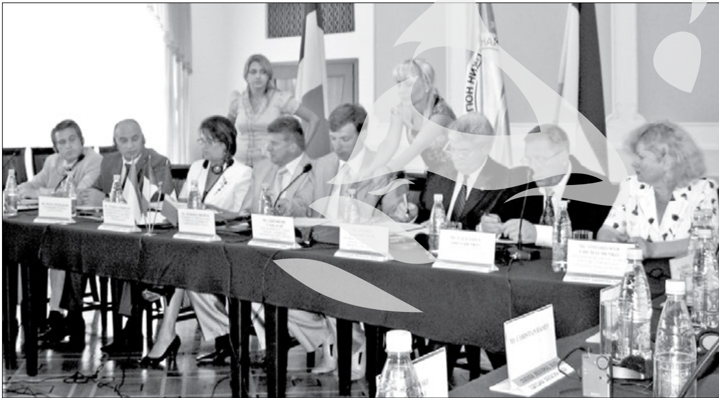
Semnarea acordului de principiu, în iulie, la Odessa

M arți, în sala Auditorium a Complexului Muzeal de Științele Naturii, se va desfășura ceremonia de acordare a personalității juridice românești Euroregiunii „Dunărea de Jos” (România – Republica Moldova – Ucraina), cu sediul la Galați, prin semnarea documentelor constitutive ale Asociației de Cooperare Transfrontalieră a Euroregiunii. Un moment important, care face trecerea de la faza cooperării „artizanale” la constituirea unei adevărate mașinării tehnice, cu sediul în Galați, care va putea lucra la proiecte comune mari, cu finanțare europeană, în beneficiul celor trei părți. La conferința internațională organizată cu acest prilej, au fost invitați membrii Euroregiunii, reprezentanți ai altor euroregiuni din România, ai organizațiilor internaționale ce sprijină cooperarea transfrontalieră și interregională, ai Ministerelor de Externe ale celor trei țări, precum și actori locali publici și privați implicați în relații de cooperare transfrontalieră. Conferința va fi urmată, seara, de